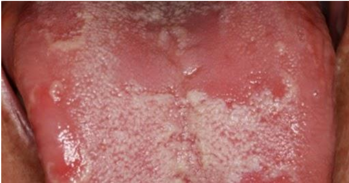
Slika 4. Glositis (CC BY)

Nedostatak vitamina B3 manifestira se kao pelagra, bolest kože. Početkom 20. stoljeća bila je česta pojava kod ljudi s nedovoljnim unosom kukuruza u prehrani koja je tada bila glavni izvor niacina. Pelagra je praćena promjenama na koži - lezije kože, kao i promjenama u usnoj šupljini - glositis, halitoza, aftozni stomatitis. Halitoza je neugodan zadah iz usta uzrokovana bakterijama ili suhoćom usta (24).