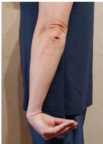
Slika 5. Vježba istezanja mišića ekstenzora šake