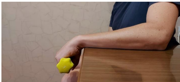
Slika 7. Vježba jačanja mišića ekstenzora šake