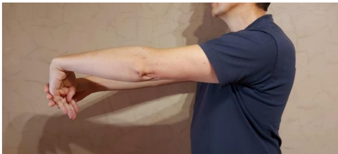
Slika 4. Vježba istezanja mišića ekstenzora šake

Vježbe istezanja: pacijent je u uspravnom stojećem položaju te zahvaćenu ruku dovede u antefleksiju od 90°. Lakat je ekstenziran, ali ne i zaključan, podlaktica i dlan su pronirani. Pacijent zatim napravi palmarnu fleksiju ne savijajući prste. Svojom će drugom rukom lagano dati potisak flektiranoj šaci te tijekom toga treba osjetiti istezanje ekstenzornih mišića šake. U tom se položaju pacijent treba zadržati 15 sekundi te ponoviti ovu vježbu pet puta nakon čega radi istu vježbu, ali samo na drugoj ruci. Ovakvu je vježbu dobro odraditi tijekom dana, pogotovo prije određene fizičke aktivnosti ili posla. Najbolje je vježbu odraditi s pet ponavljanja svake ruke po četiri puta tijekom dana kroz 5 - 7 dana u tjednu (13).