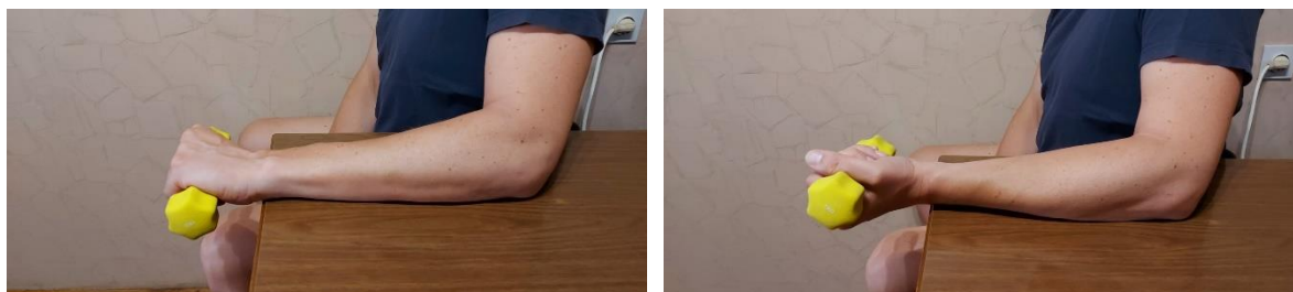
Slika 8. Vježba jačanja ekstenzora šake

Vježba supinacije i pronacije: pacijent je u uspravnom sjedećem položaju te zahvaćenu ruku stavlja na podlogu tako da je lakat flektiran pod 90°, a šaku izvan podloge. Pacijent podlakticu prvo stavlja u položaj pronacije te iz tog položaja sporo okreće podlakticu u položaj supinacije. Iz položaja supinacije polako se vraća u početni položaj pronacije. Kao i prijašnja vježba, prvo se počinje bez utega pa se s napretkom dodaje opterećenje (uteg). Nakon postignutih 30 ponavljanja tijekom dva uzastopna dana, pacijent može povećati opterećenje. Oslonac ruke na podlogu trebat će s vremenom smanjiti te bi na kraju pacijent trebao biti u mogućnosti napraviti ovu vježbu s ispruženom rukom bez oslonca. Vježba se radi najviše do 30 ponavljanja, 5 - 7 dana u tjednu (13).