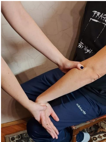
Slika 1. Mill test

Mill test : početni položaj pacijenta je sjedeći. Terapeut stane sa strane na kojoj je bolni lakat. Prvo terapeut jednom rukom palpira lateralni epikondil lakta. Drugom rukom terapeut drži distalni dio ruke pacijenta, točnije oko zapešća i na području metakarpalnih kostiju. Pacijent flektira lakat do 90°. Tijekom palpacije terapeut klijentu ili pacijentu izvodi pasivnu ekstenziju lakta, pronaciju podlaktice, ulnarnu devijaciju i fleksiju zapešća. Test je pozitivan ako se pacijentu pojavi osjećaj bolnosti u području lateralnog epikondila (23).