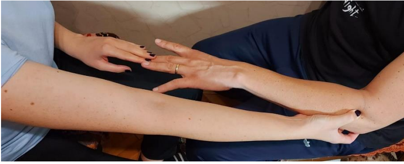
Slika 2. Maudsley test