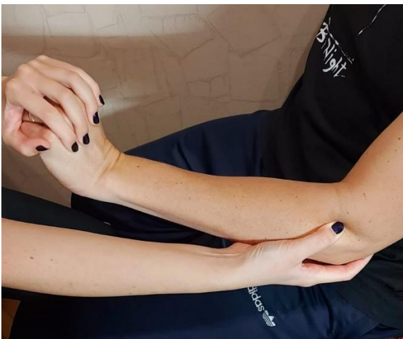
Slika 3. Cozen test

Cozen test: pacijent može biti u sjedećem ili u stojećem položaju. Terapeut stane ili sjedne sa strane pacijenta na kojoj se javlja bolnost te mu namjesti ruku tako da je ona pronirana, lakat da je savijen, to jest flektiran, zapešće da je ekstenzirano i u položaju radijalne devijacije. Šaka je stisnuta, to jest zatvorena što dovodi do skraćivanja mišića ekstenzora. U tom položaju terapeut jednom rukom palpira lateralni epikondil, a drugom rukom obuhvati pacijentovo zapešće. Terapeut napravi palmarnu fleksiju dok pacijent pruža otpor. Test će biti pozitivan kad pacijent osjeti bol u području lakta ili sveopću slabost mišića (25,26).