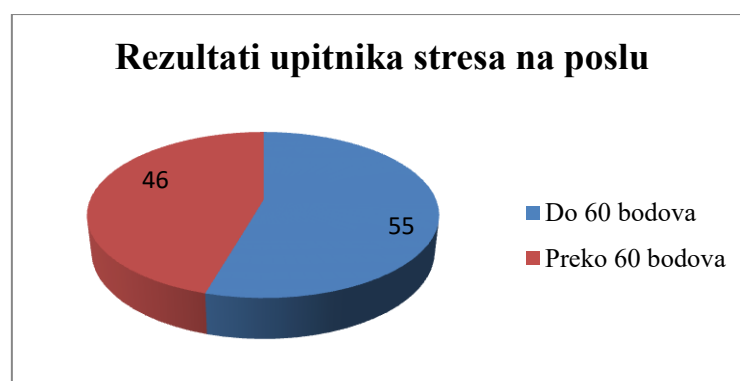
Slika 3. Rezultati upitnika stresa na poslu

Medijan ukupnog upitnika o intenzitetu stresa na poslu iznosi 57 (interkvartilnog raspona od 46 do 67) u rasponu od 20 do 90 te 46 (45 %) ispitanika ima ukupan rezultat preko 60 bodova (Slika 2).