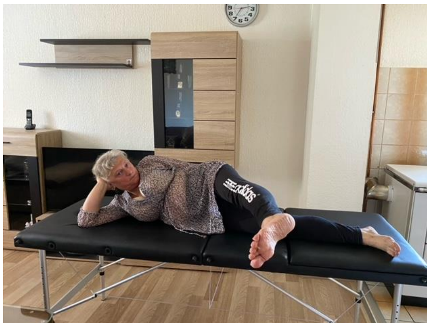
Slika 12. Jačanje mišića trbuha i nogu