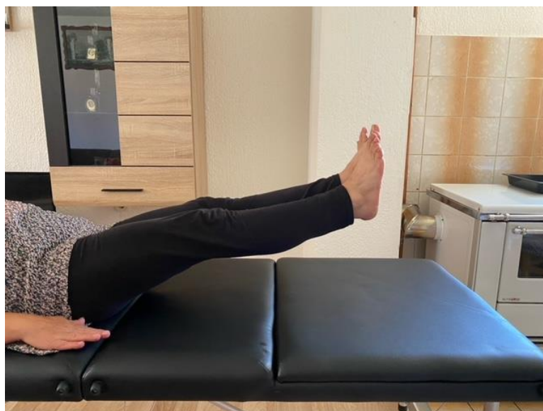
Slika 10. Jačanje trbušne muskulature

U još jednoj modifikaciji početne vježbe za jačanje trbušnih mišića pacijentica podiže obje noge istovremeno i drži tijelo u tom položaju 5 – 10 sekundi. Vježbu također ponavlja 5 – 10 puta (slika 10).