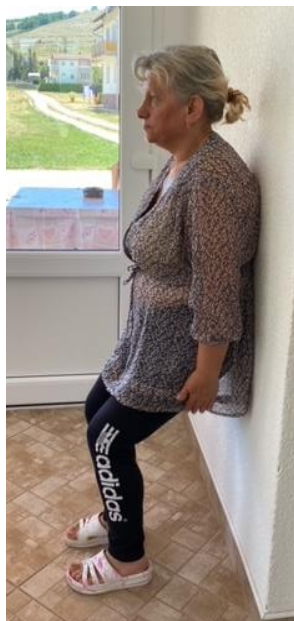
Slika 3. Jačanje mišića nogu