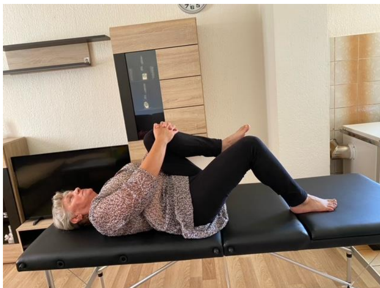
Slika 8. Jačanje trbušne muskulature

U nastavku planiranog programa tjelovježbe pacijentica izvodi modifikaciju početne vježbe jačanja trbušne muskulature tako da iz položaja ležeći na leđima savija naizmjenice jednu pa drugu nogu pod kutom od 90 stupnjeva. Koljeno potiskuje na prsa dok istovremeno daje otpor rukama. Zadržava poziciju 5 – 7 sekundi te ponavlja vježbu sa svakom nogom 5 do 10 puta. Vježba je prikazana na slici 8.