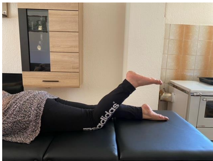
Slika 5. Jačanje mišića nogu

Modificiranjem početne vježbe jačanja mišića leđa pacijentica uz leđne mišiće jača i mišiće nogu i stopala tako da savija nogu u koljenu do najviše 90 stupnjeva iz ležećeg položaja na trbuhu, a kako je prikazano na slici 5 u nastavku.