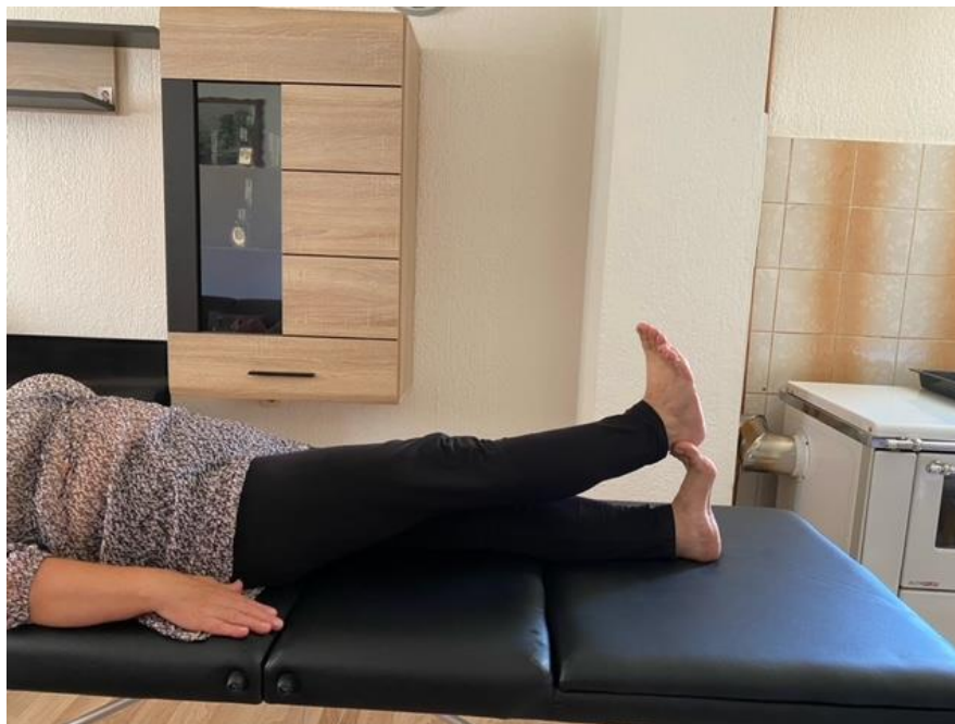
Slika 11. Jačanje trbušne muskulature

Pacijentica planirani program vježbanja nastavlja još jednom modifikacijom početne vježbe jačanja trbušne muskulature podizanjem jedne noge i spuštanjem na podignuto stopalo druge noge. Ta je vježba usmjerena na jačanje trbušne muskulature i mišića nogu. Podignutu nogu drži u položaju na podignutom stopalu druge noge 5 – 7 sekundi, a vježbu sa svakom nogom naizmjenice ponavlja 10 puta (slika 11).