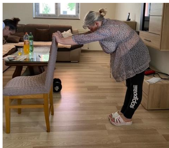
Slika 27. Opuštanje