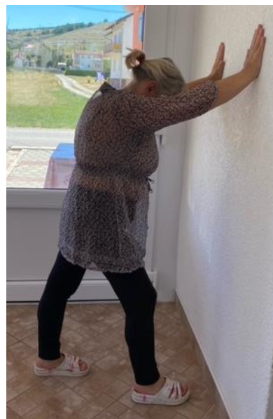
Slika 29. Istezanje mišića stražnje strane potkoljenice