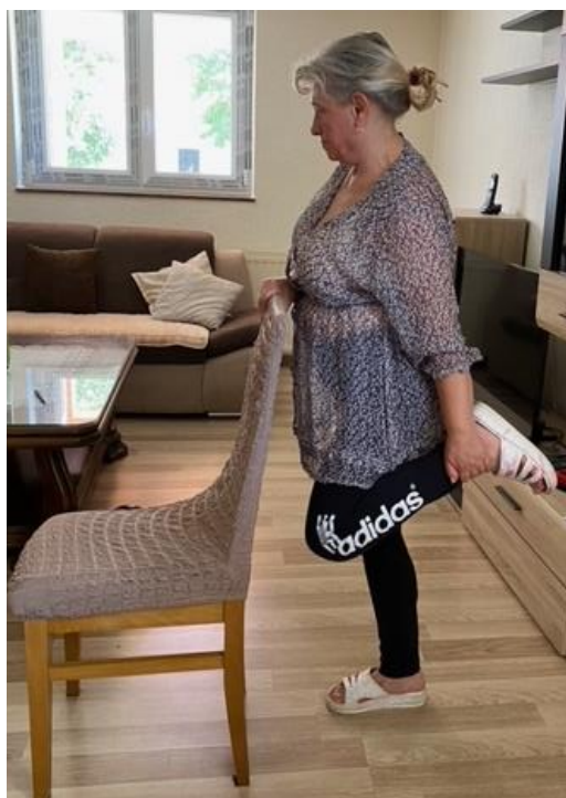
Slika 23. Spretnost i ravnoteža

Zadnji dio preporučene tjelovježbe, prije opuštanja, usmjeren je na vježbe spretnosti i ravnoteže koji kombinira i pristup jačanju muskulature donjeg dijela trupa, odnosno muskulature trbuha i nogu. Takav trening zahtijeva dinamičku stabilnost i stabilnost tijela i predstavlja važan dio fizioterapije kod osteoporoze. Pacijentica stoji u uspravnom položaju, jednom rukom pridržava se za stolicu kako bi osigurala ravnotežu te savija nogu u koljenu i pritom stopalo vuče prema stražnjici suprotnom rukom. U tom položaju ostaje dok ne nabroji do 3 te izravna (spusti) savinutu nogu na pod (slike 23 i 24).