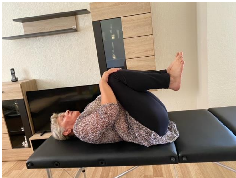
Slika 7. Jačanje trbušne muskulature