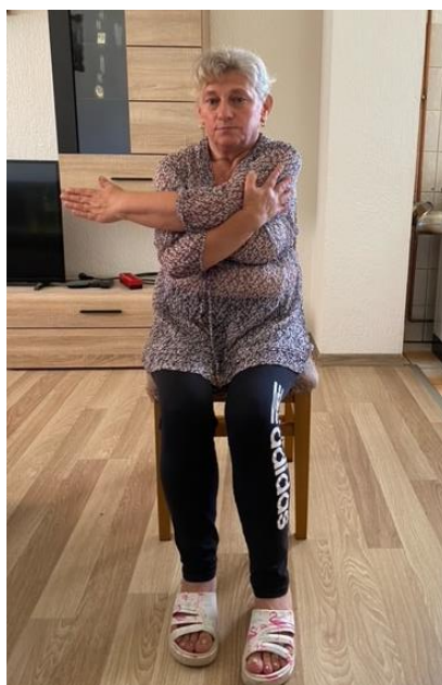
Slika 18. Jačanje mišića ramena

Vježbe za jačanje ramena pacijentica nastavlja izvoditi sjedeći na stolici s kralježnicom u ravnom položaju. Iz početnog položaja pacijentica pravilno dišući potiskuje desnu ruku iz ramena prema lijevoj ruci. Kada postigne mogući položaj, ostaje u tom položaju dok polako ne izbroji do 3 te se opušta izdišući. Vježbu ponavlja 8 – 10 puta (slika 18).