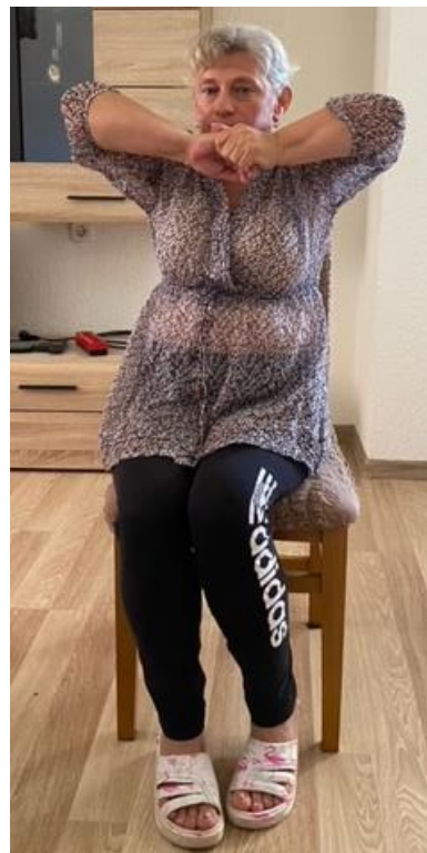
Slika 19. Jačanje mišića ramena Slika 20. Jačanje mišića ramena