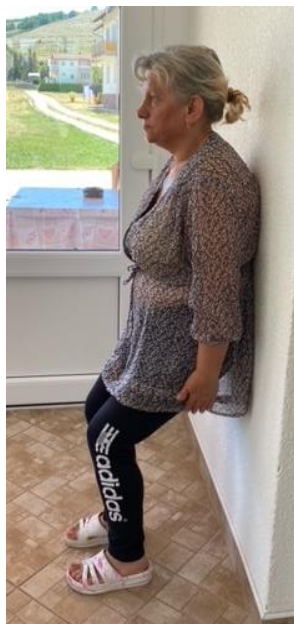
Slika 3. Jačanje mišića nogu