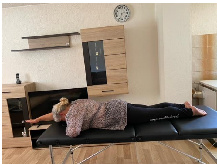
Slika 4. Jačanje mišića nogu

Slijede vježbe jačanja mišića leđa koje pacijentica izvodi ležeći na trbuhu tako da podiže obje ruke od poda te ih naizmjenice pruža i savija do razine ramena pritom kontrahirajući leđnu muskulaturu. Pozornost treba obratiti na to da pacijentica ne podiže previsoko gornji dio tijela te da ne savija vratnu kralježnicu. Vježba se izvodi u 2 – 4 serije s 15 – 20 ponavljanja (slika 4).