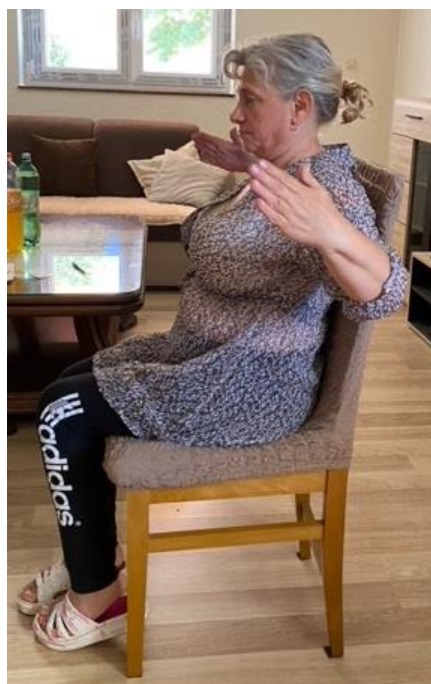
Slika 22. Jačanje mišića ramena

Zatim pacijentica nastavlja izvoditi vježbu tako da ruke savija u laktu te u ravnini ramena otklanja ruke. Pacijentica zadrži položaj dok izbroji do 3 te se opušta izdišući. Vježbu ponavlja 8 – 10 puta (slika 22).