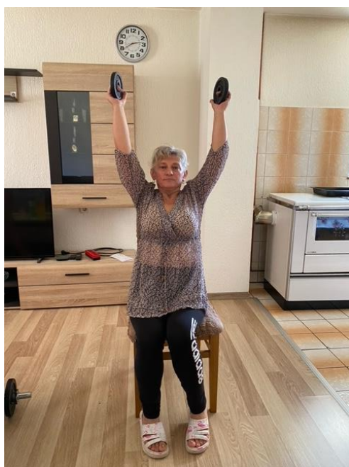
Slika 14. Jačanje mišića ramena

Početna pozicija za vježbu koju pacijentica izvodi jest sjedeći položaj na stolici s ravnom kralježnicom. Pacijentica podiže nadlaktice prema van i paralelno s tlom, s laktovima savijenim pod kutom od 90 stupnjeva i utezima za ruke, ako da zauzima pozu kako bi pokazala mišiće bicepsa. Kada podiže utege, dlanovi i prsti trebaju biti okrenuti prema unutarnjem dijelu tijela. Iz tog početnog položaja pacijentica polako izdiše i polako podiže ruke i ispravlja laktove, spajajući utege iznad glave. Kratko zastane, a zatim udahne vraćajući se u početni položaj. Tijekom te vježbe treba održavati ravna (ne savijena) leđa i skupljeni trbuh. Zatim podiže utege iznad glave pritom pružajući ruke (slike 14 i 15).