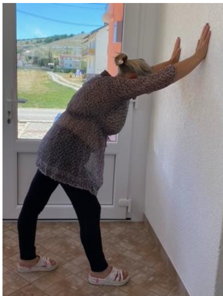
Slika 28. Istezanje mišića stražnje strane potkoljenice