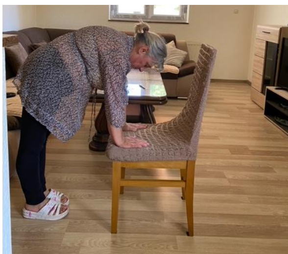
Slika 26. Opuštanje

Na kraju preporučene tjelovježbe u prevenciji i liječenju osteoporoze pacijentica izvodi vježbe opuštanja. Pacijentica se sagiba polažući ruke na stolicu te izvija leđa kako bi opustila miškulaturu leđa i ramena. Taj položaj pacijentica zadržava 10 – 15 sekundi, zatim izravna trup i nakon odmora u trajanju 3 – 5 sekundi ponavlja vježbu. Vježba se ponavlja 8 – 10 puta (slika 26). Zatim staje iza stolice te otklanja trup od naslona stolice u visini ramena i savija leđa kako bi opustila miškulaturu leđa i ramena. Kao i kod prvog dijela vježbe, taj položaj pacijentica zadržava 10 – 15 sekundi, zatim izravna trup i nakon odmora u trajanju 3 – 5 sekundi ponavlja vježbu. Vježba se ponavlja 8 – 10 puta (slika 27).