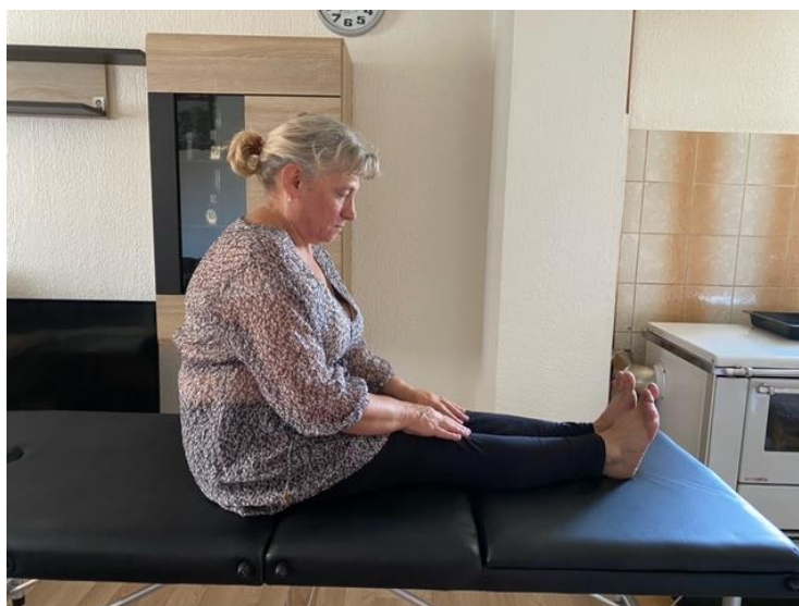
Slika 13. Opuštanje mišića trbuha

Slijede vježbe opuštanja muskulature trbuha koje pacijentica izvodi u sjedećem položaju s ravnom kralježnicom ispruženih ruku (slika 13).