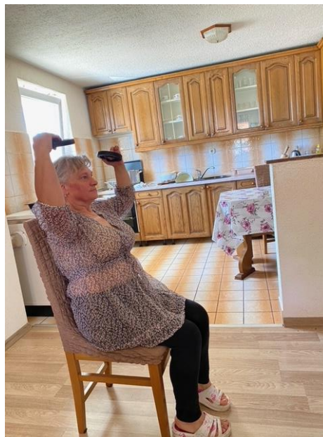
Slika 17. Jačanje mišića ramena