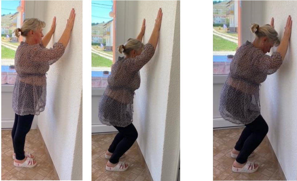
Slika 2. Jačanje mišića nogu