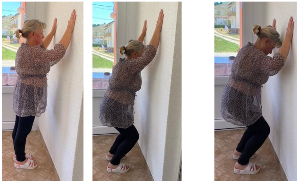
Slika 2. Jačanje mišića nogu