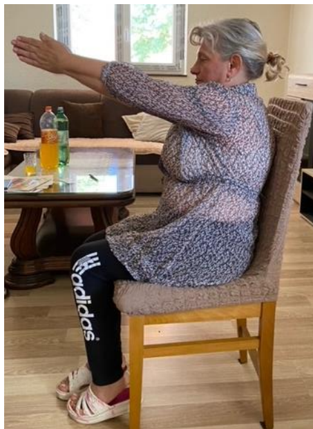
Slika 21. Jačanje mišića ramena