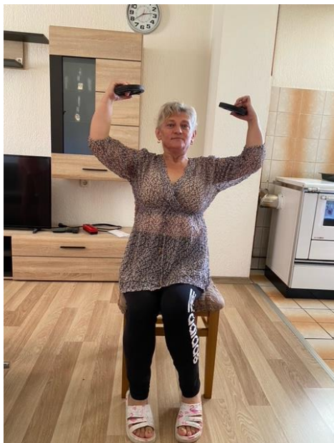
Slika 16. Jačanje mišića ramena