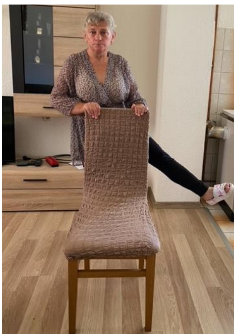
Slika 25. Spretnost i ravnoteža

Pacijentica zatim iz početnog položaja, tj. stajanja iza stolice i pridržavanjem za stolicu objema rukama kako bi održala ravnotežu, otklanja od tijela najprije jednu, a zatim drugu nogu. Kada otkloni nogu od trupa, pacijentica zadržava položaj dok ne izbroji do 3. Tu vježbu pacijentica ponavlja 8 – 10 puta svakom nogom (slika 25).