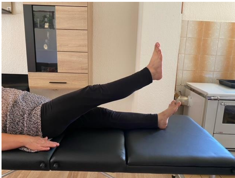
Slika 9. Jačanje trbušne muskulature

Nakon završetka te vježbe, pacijentica pruža noge i ležeći na leđima podiže naizmjenično jednu pa drugu nogu, držeći svaku nogu u podignutom položaju 5 – 7 sekundi. Vježbu ponavlja 5 – 10 puta te time dodatno ojačava mišiće trbuha (slika 9).