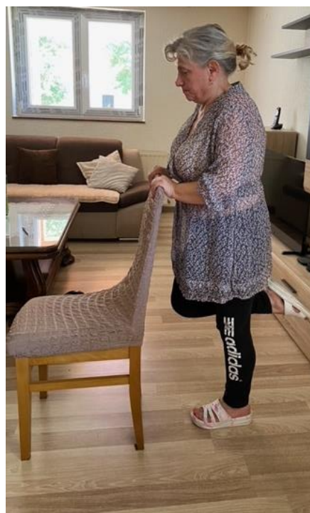
Slika 24. Spretnost i ravnoteža