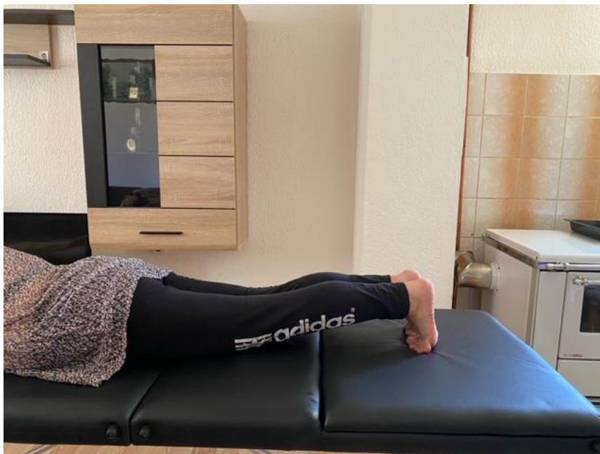
Slika 6. Izdržaj