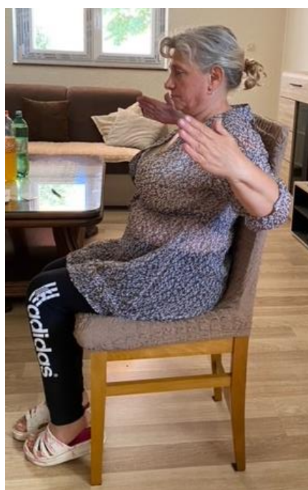
Slika 22. Jačanje mišića ramena

Zatim pacijentica nastavlja izvoditi vježbu tako da ruke savija u laktu te u ravnini ramena otklanja ruke. Pacijentica zadrži položaj dok izbroji do 3 te se opušta izdišući. Vježbu ponavlja 8 – 10 puta (slika 22).