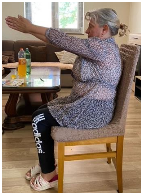
Slika 21. Jačanje mišića ramena