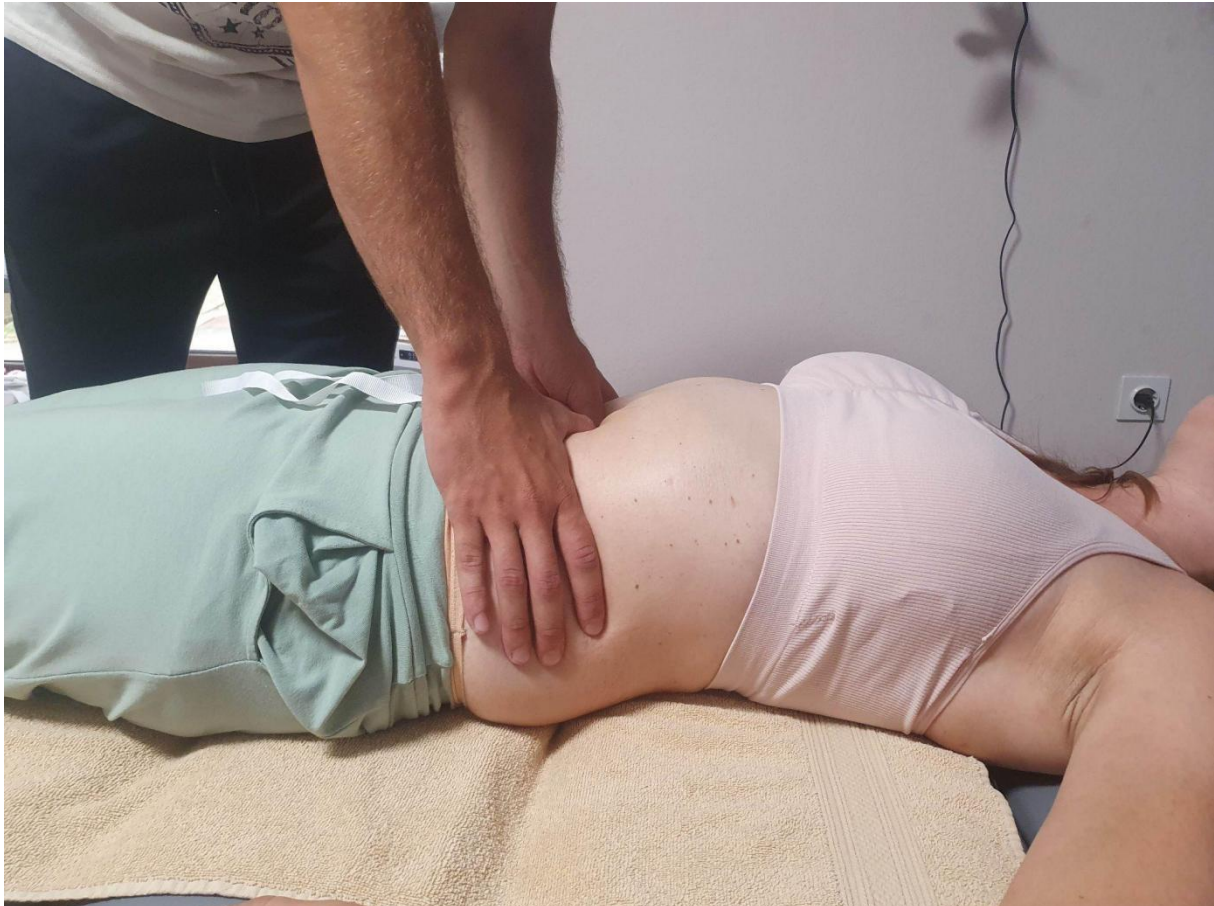
Slika 4. Masaža trbuha pacijentice zbog diastasis recti

Terapija masažom za diastasis recti kod pacijentice može biti vrlo korisna za ponovno uspostavljanje pravilnog trbušnog tonusa sve dok surađuje s fizikalnim terapeutom koji je specijaliziran za to pitanje, ali i u svome domu s autorom rada.