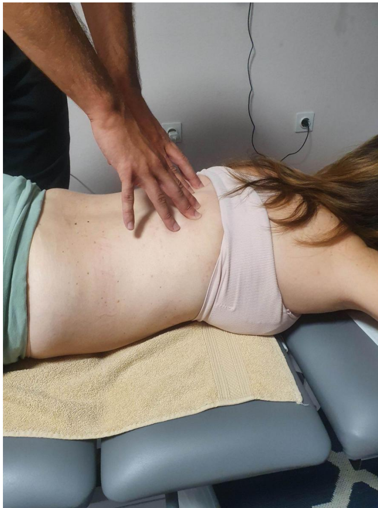
Slika 2. Primjena duboke masaže kod pacijentice