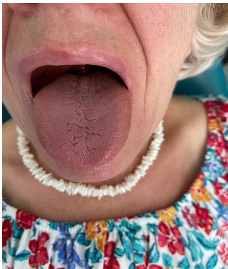
Slika 1. Prikaz fisura na dorzalnoj strani jezika, nedostatak okusnih pupoljaka

Pacijentica dolazi u ordinaciju oralne patologije sa subjektivnim simptomom suhих usta. Pri inspekciji usne šupljine zapažene su fisure na površini jezika te nedostatak okusnih pupoljaka. (Slika 1.)