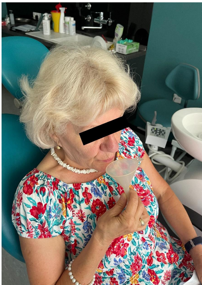
Slika 3. Provođenje dijagnostičkog postupka - sijalometrija

Pacijentici je dana epruveta za mjerenje količine sline u koju je tijekom jedne minute izbacila prvo nestimuliranu, a zatim stimuliranu slinu. (Slika 3.)