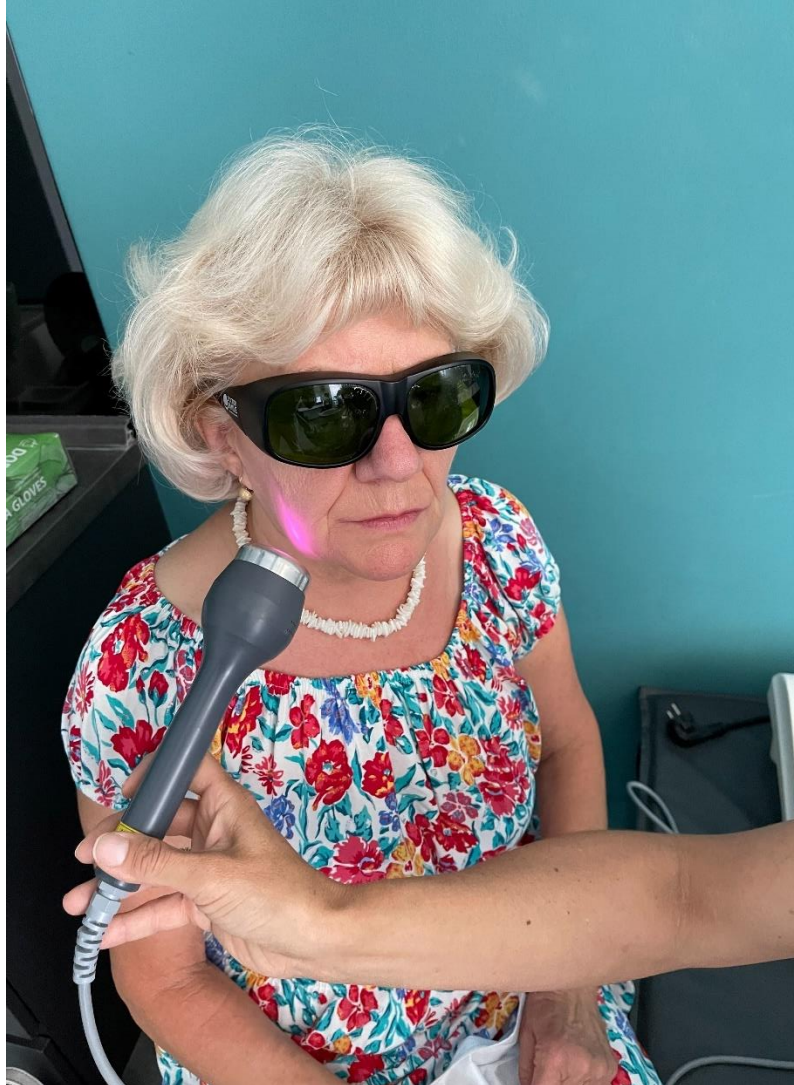
Slika 5. Ekstraoralna primjena niskoenergetskog lasera u području žlijezde parotide.

Laser se primjenjivao ekstraoralno s obje strane u područje parotidne i submandibularne žlijezde. (Slika 5.)