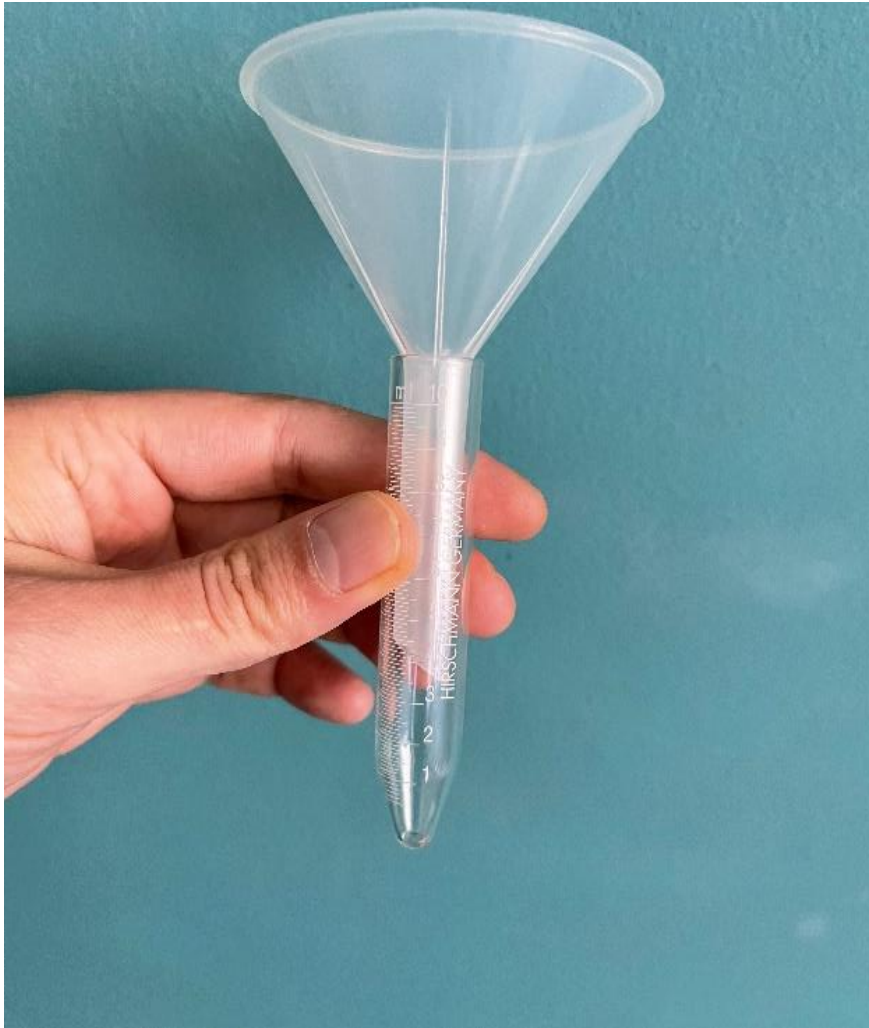
Slika 2. Epruveta za mjerenje količine sline

Provedeno je sijalometrijsko ispitivanje pomoću mjerne epruvete. (Slika 2.)