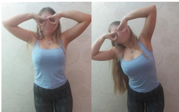
Slika 3. Vježba „maska“