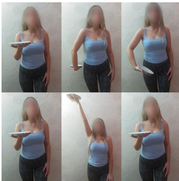
Slika 4. Vježba s tanjurom