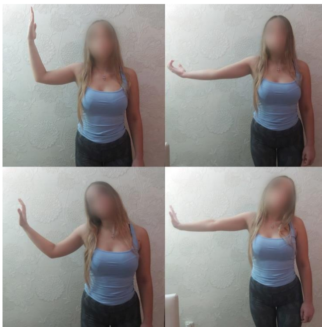
Slika 5. Miofascijalna relaksacija

Miofascijalna relaksacija vrsta je manualne terapije. Ona uključuje lagane i kontinuirane pokrete istezanja, što pomaže pri smanjenju pritiska na UŽ. Važno je rasteretiti proksimalni dio UŽ-a uz istezanje fleksornih i pronatornih mišića. Pacijent može vršiti istezanje samostalno, savijanjem glave na zahvaćenu stranu uz elevaciju lopatice, supinaciju podlaktice i ekstenziju lakta, a zatim suprotnom rukom uzima šaku te ekstendira ručni zglob. Istezanje može biti postupno i manjeg opsega pokreta ukoliko je pacijentov UŽ iritabilan. Nakon toga pacijent vraća glavu i lopaticu u neutralan položaj, dok su ručni zglob i prsti s ulnarne strane u blagoj fleksiji (36, 38).