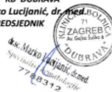
Slika 2. Slika zamolbe za odobrenje znanstvenog istraživanja