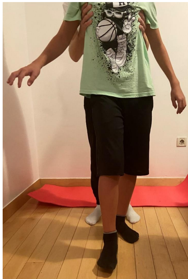
Slika 17. Habilitacija hoda pacijenta gdje ga se uči pravilnom obrascu hoda i korigira postojeći