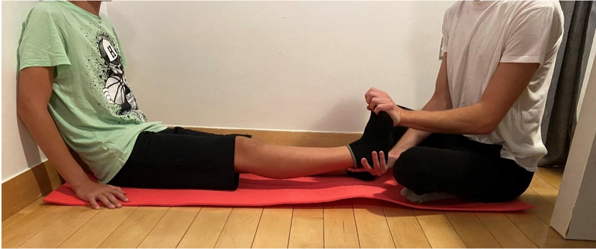
Slika 6. Pasivno istežanje Ahilove tetive u dorzifleksiju pri ekstenziranom koljenu koje izvodi fizioterapeut