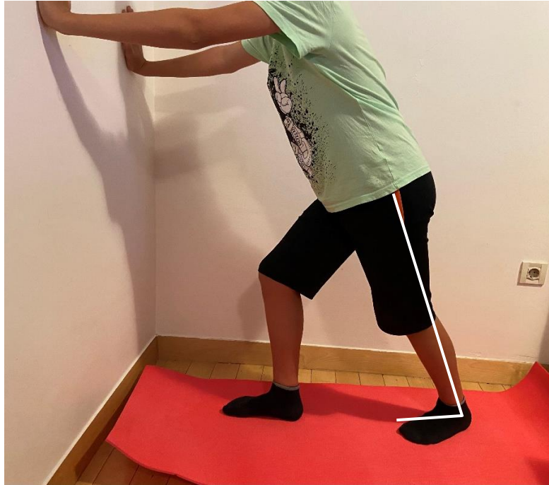
Slika 8. Vježba istezanja Ahilove tetive uz ekstenzirano koljeno (uz korekcije zbog izostanka dorzifleksije gležnja, pacijentovo stopalo je u položaju valgusa i nije u mogućnosti u potpunosti ekstenzirati koljeno)