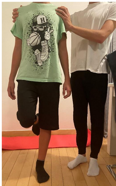
Slika 13. Vježba propriocepcije na jednoj nozi uz prisutnost fizioterapeuta