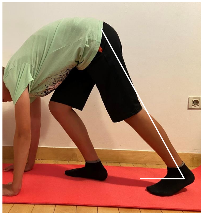
Slika 11. Vježba istezanja Ahilove tetive u četveronožnom položaju (uz korekcije pacijent nije mogao postaviti stopalo cijelom dužinom na podlogu pri eksteniranom koljenu)