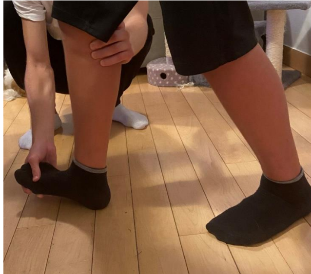
Slika 16. Habilitacija hoda pacijenta gdje ga se uči pravilnom obrascu hoda i korigira postojeći