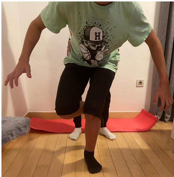
Slika 14. Vježba propriocepcije na jednoj nozi prelaskom iz stojećeg položaja u čučanj uz prisutnost fizioterapeuta (uz korekcije pacijent zbog slabije propriocepcije nije mogao ispravno izvesti vježbu) – „izvorna slika autora“