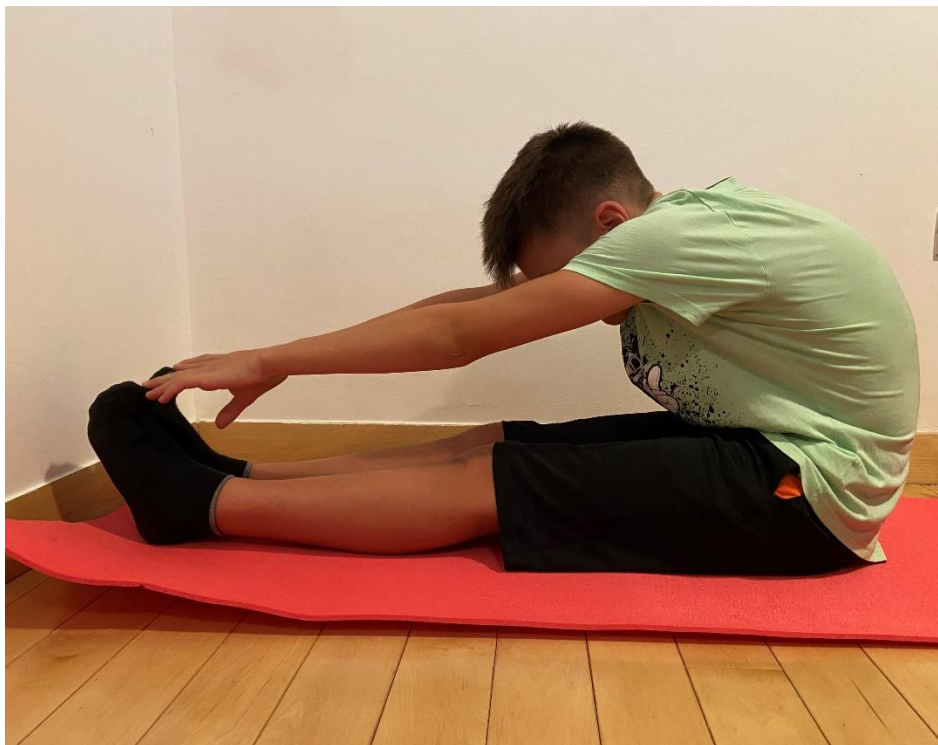
Slika 5. Vježba istezanja kralježnice i gležnja s ciljem doticaja prstiju ruku s nožnim prstima uz ekstenzirana koljena – „izvorna slika autora“