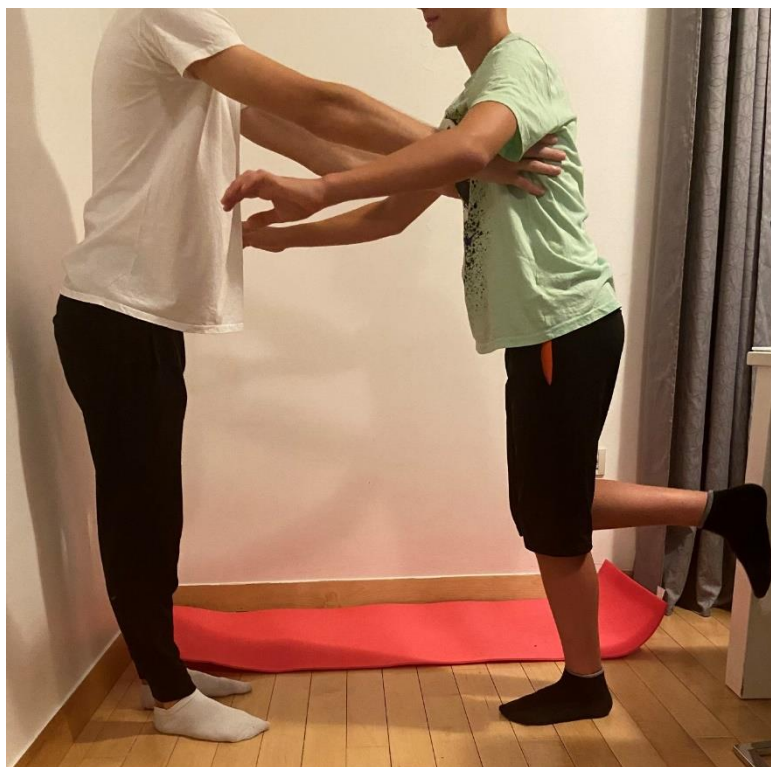
Slika 15. Vježba propriocepcije na jednoj nozi nagnjući se prema naprijed uz prisutnost fizioterapeuta