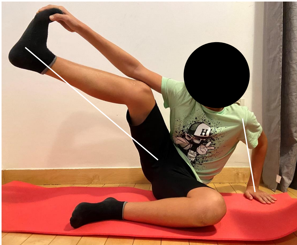
Slika 7. Vježba istežanja Ahilove tetive, pacijentova lijeva ruka i desna noga trebaju biti ekstenzirane (uz korekcije pacijent zbog manjka fleksibilnosti i ograničenog ROM-a gležnja nije u mogućnosti izvesti pravilno vježbu) – „izvorna slika autora“