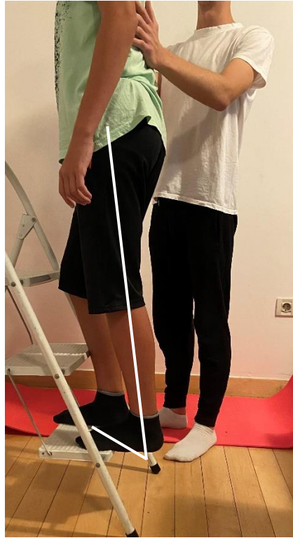
Slika 12. Vježba istezanja Ahilove tetive na rubu povišene površine uz prisutnost fizioterapeuta (uz korekciju pacijenta nije mogao pravilno izvesti vježbu)