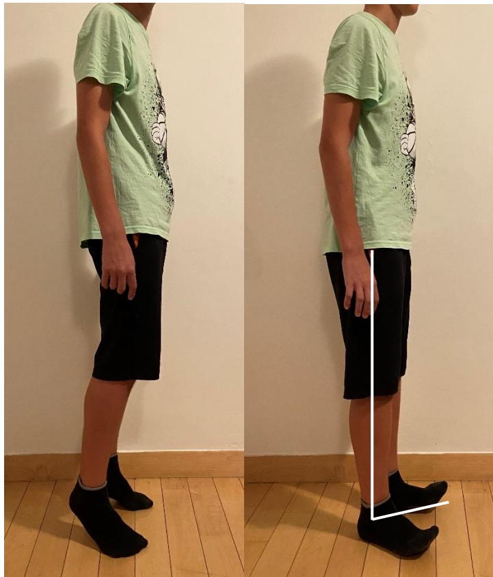
Slika 1. i Slika 2. Vježba prijenosa težine s nožnih prstiju na pete

Svaka vježba se izvodi 30 sekundi po 4 ponavljanja uz prisutnost fizioterapeuta.