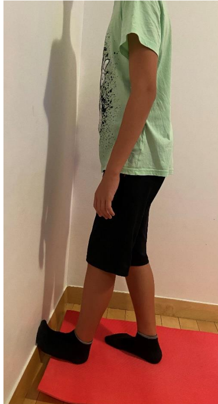
Slika 10. Vježba istezanja Ahilove tetive oslanjajući stopalo na zid (uz korekcije pacijent nije mogao pravilno izvesti ovu vježbu zbog ROM-a od 0° u gležnju)