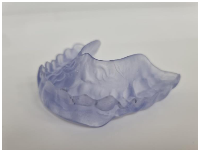
Slika 4. Relaksacijska udlaga

i kutijicu u kojoj se relaksacijska udlaga skladišti. Medij za skladištenje treba biti vlažan, kako ne bi došlo do deformacije materijala od kojeg je udlaga izrađena (25).