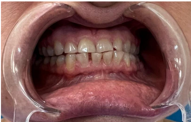
Slika 3. Klinička slika atricije zuba kod pacijenta s dijagnosticiranim bruksizmom