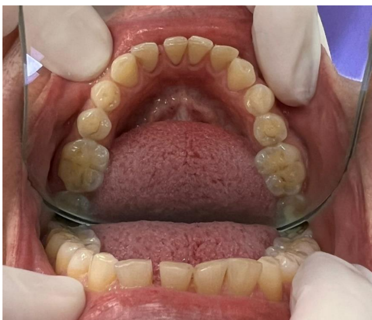
Slika 2. Atricija zuba mandibularnog zubnog luka