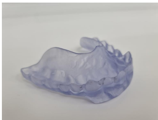
Slika 5. Relaksacijska udlaga