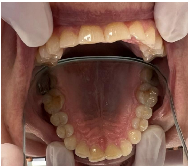
Slika 1. Atricija zuba maksilarnog zubnog luka