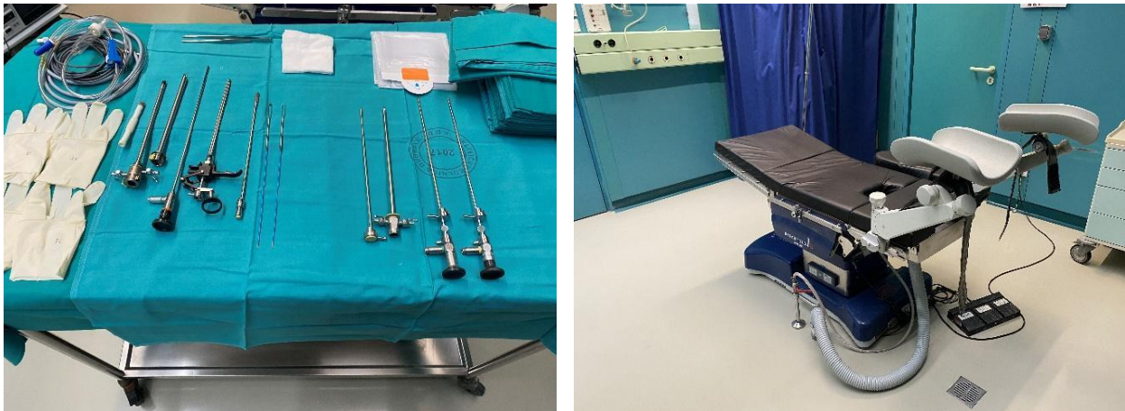
Slika 2. A) Oprema za transuretralnu resekciju, B) Endoskopski stol za urološku dijagnostiku i zahvate

bolesnici imaju postavljen urinarni kateter za trajno ispiranje, što zahtjeva neposredno praćenje radi mogućeg ranog postoperativnog krvarenja. Neki od istih bolesnika su i kandidati za ranu postoperativnu intravezikalnu kemoterapiju koja se provodi na odjelu. Dio sestara sudjeluje u polikliničkim djelatnostima poput rada u ambulanti i dnevnoj bolnici. Ambulantna djelatnost obuhvaća dijagnostiku i praćenje. Intravezikalna terapija najčešće ne zahtjeva bolničku skrb te se najčešće provodi u dnevnoj bolnici. Tamo je bolesnicima omogućena kvalitetna zdravstvena skrb, visoko educirano osoblje, udoban smještaj za liječenje i praćenje nakon terapije. Ponekad je intravezikalna terapija praćena komplikacijama liječenja. Najčešće se takvi bolesnici javljaju u hitnu urološku ambulantu, gdje medicinske sestre i tehničari sudjeluju u zbrinjavanju istih, koje ponekad zahtjevaju i bolničko liječenje. Radi specifičnosti takvog liječenja, Europsko udruženje medicinskih sestara u urologiji (Engl. The European Association of Urology Nurses, EAUN) objavila je smjernice za intravezikalnu instilaciju kemoterapije i imunoterapije s ciljem poboljšanja trenutne prakse, pružanja znanstvene potpore i poboljšanja postojećih protokola koji sve više prepoznaju individualno stanje svakog bolesnika (41).