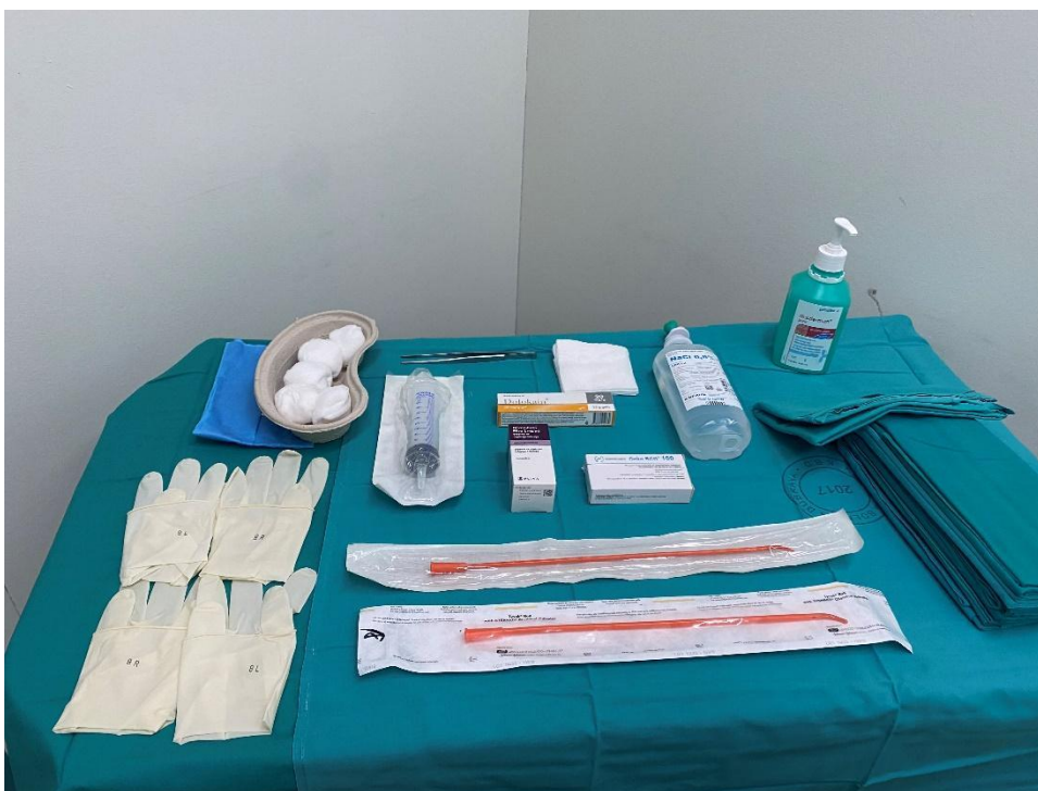
Slika 4. Oprema za primjenu intravezikalne terapije