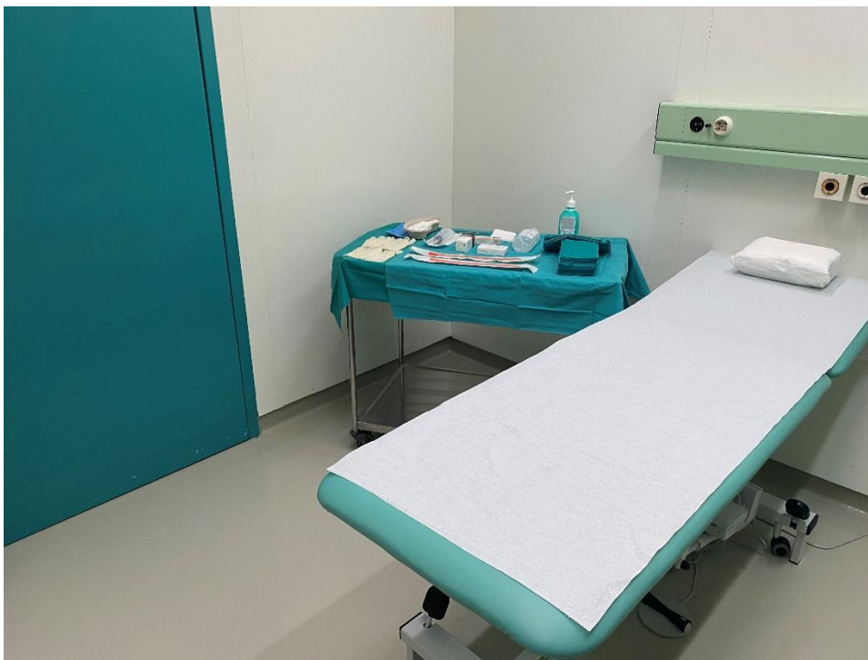
Slika 3. Krevet i pomoćni stolić s opremom za primjenu intravezikalne terapije