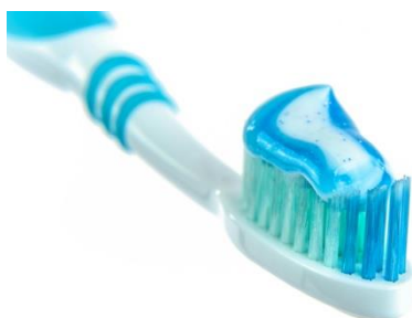
Slika 2. Creative Commons license (licenca CC BY)

Vrste četkica koje se mogu koristiti su manualna, električna i ultrazvučna. U istraživanjima se dokazalo da su ultrazvučna i zvučna četkica (slika 3) učinkovitije od manualnih (slika 2) u uklanjanju zubnog plaka i smanjenju nastanka gingivitisa (12).