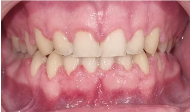
Slika 1. Hiperplanzij gingive uzrokovan lošom oralnom higijenom tijekom terapije metalnom ortodontskom napravom (osobno vlasništvo dr. sc. Martine Čalušić Šarac, dr. med. dent, spec. ortodontcije).

Temeljni element prevencije parodontne bolesti učinkoviti su svakodnevni profilaktično-higijenski postupci za uklanjanje zubnog plaka što smanjuje rizik nastanka krvarenja i gingivitisa. Cilj je ovoga rada ispitati koja metoda motivacije pacijenata, za održavanje oralne higijene tijekom terapije fiksnim ortodontskim napravama, poručuje najbolje rezultate - motivacija razgovorom nakon postavljene naprave, pisane ili video upute.