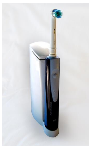
Slika 3. Creative Commons license (licenca CC BY)