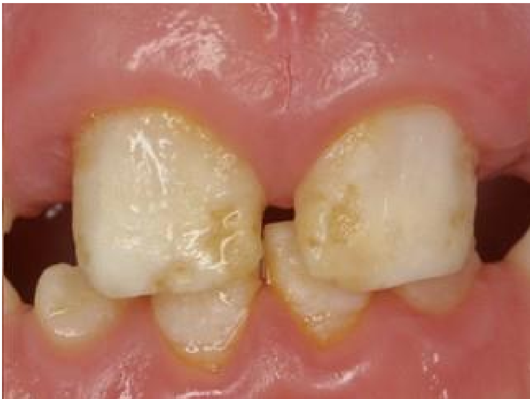
Slika 1. Amelogenesis imperfecta mliječnih zubi – hipoplastični oblik (CC BY)

Amelogenesis imperfecta je anomalija zuba s promjenama na caklini koja se osim kod deficita vitamina A očituje i kod nedostatka vitamina D ili je nasljedna anomalija. Najučestaliji je oblik ove promjene na caklini hipoplastični oblik, gdje kod nedostatka vitamina D anomalija može varirati od blagih promjena boje, kvalitete i količine cakline pa do ozbiljne strukturne promjene. Hipoplazija se pojavljuje u obliku bijelih ili žuto-smeđih mrlja na caklini, često u primarnoj denticiji i može uzrokovati nedostatke na površinama zuba trajnih nasljednika. Osim estetskih promjena, hipoplazija uzrokuje osjetljivost zuba i predispoziciju za karijes (8).