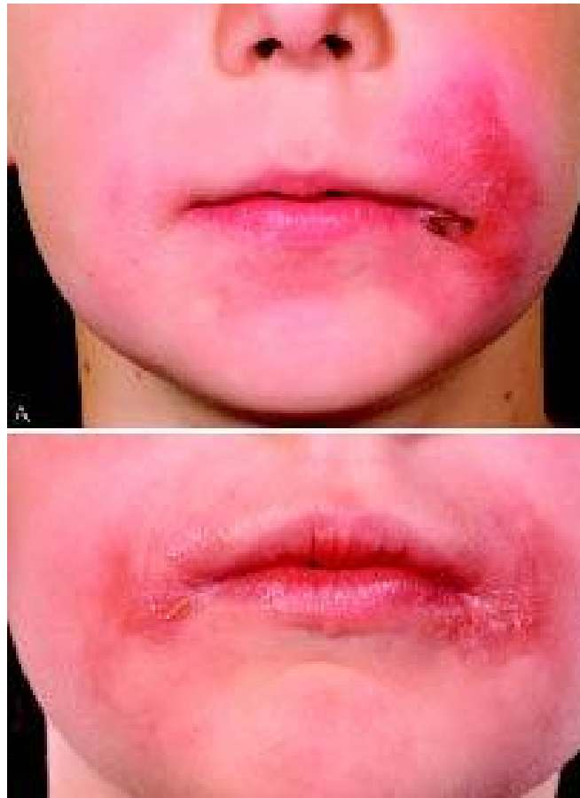
Slika 5. Angularni helitis

Folna kiselina - vitamin B9 bitan je u prehrani trudnica. Sudjeluje u sintezi DNK-a, utječe na rast ploda i prevenciju teških malformacija djeteta. Prije se nedostatak folne kiseline viđao kod djece hranjene kozjim mlijekom jer takvo mlijeko ne sadrži ovaj vitamin. Danas to više nije problem zbog dojenja i dodataka vitamina adaptiranim mliječnim pripravcima. Nedostatna količina vitamina B9 očituje se kao megaloblastična anemija. Vitamin B9 povoljno djeluje na djecu oboljelu od celijakije, Crohnove bolesti i ulceroznoga kolitisa. Posljedica nedostatka vitamina B9 uočava se na mekim oralnim sluznicama i očituje se kao gingivitis, oboljenje zubnoga mesa sa znakovima otečenosti i krvarenja na dodir. Ograničeno je na područje mekoga tkiva. Još se javlja i angularni helitis, oboljenje oko rubova usana i glositis, oboljenje jezika (7, 28, 29).