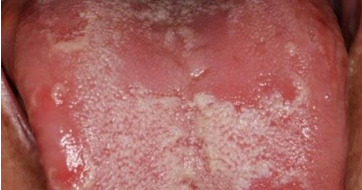
Slika 4. Glositis (CC BY)

Nedostatak vitamina B3 manifestira se kao pelagra, bolest kože. Početkom 20. stoljeća bila je česta pojava kod ljudi s nedovoljnim unosom kukuruza u prehrani koja je tada bila glavni izvor niacina. Pelagra je praćena promjenama na koži - lezije kože, kao i promjenama u usnoj šupljini - glositis, halitoza, aftozni stomatitis. Halitoza je neugodan zadah iz usta uzrokovana bakterijama ili suhoćom usta (24).