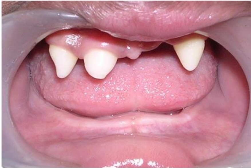
Slika 2. Ektodermalna displazija (CC BY)

Kod ektodermalne displazije u usnoj šupljini javlja se hipodoncija većega broja zubiju koji imaju nepravilan oblik (konusni oblik). Zubi su manji od prosjeka i većinom se samo devet stalnih zubiju nalazi u usnoj šupljini, i to najčešće očnjaci i prvi kutnjaci. Takav poremećaj može imati za posljedicu asimetrični razvoj alveolarnoga grebena. Konusni zubi često su hipoplastični (9).