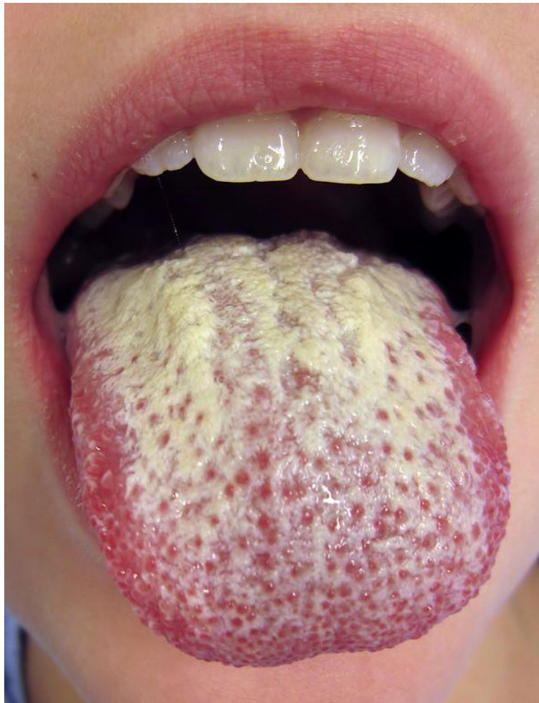
Slika 6. Oralna kandidijaza (CC BY)

pojavljuje se slabost, pareza udova i problemi s oštrinom vida. Od oralnih manifestacija pojavljuje se kandidijaza na oralnoj sluznici. Oralna kandidijaza je zaraza uzrokovana gljivicom Candida albicans . Usred oboljenja od oralne kandidijaze zapažaju se bijele mrlje na jeziku, grlu i na drugim dijelovima oralne šupljine. Može se pojaviti bol na zahvaćenom području i problemi s gutanjem. Kod dojenčadi je najčešća pseudomembranozna kandidijaza (4, 26, 30 - 34).