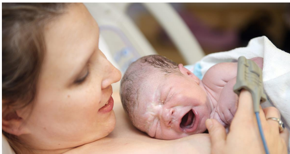
Slika 1. Kontakt koža na kožu majke i novorođenčeta

Pupkovina se zamota sterilnom gazom (16). Nakon presijecanja pupkovine, kada je novorođenče stabilno, najbolje je započeti rani kontakt koža na kožu. Ono se golo postavlja na gola prsa majke, a oboje su prekriveni pokrivačem radi očuvanja temperature. Kontakt koža na kožu poboljšava ishod dojenja te kardiorespiratornu stabilnost novorođenčeta. Na taj se način majka i novorođenče ponovo upoznaju i nastavljaju prekinutu vezu te uspostavljaju funkciju dojenja koje pomaže što boljem stvaranju funkcije digestivnoga trakta djeteta (kolonizira se majčinim mikroorganizmima s kože prije negoli bolničkim mikroorganizmima).