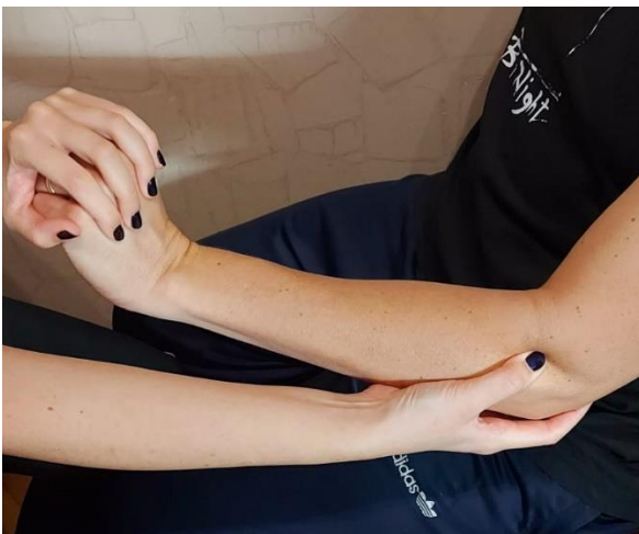
Slika 3. Cozen test

Cozen test: pacijent može biti u sjedećem ili u stojećem položaju. Terapeut stane ili sjedne sa strane pacijenta na kojoj se javlja bolnost te mu namjesti ruku tako da je ona pronirana, lakat da je savijen, to jest flektiran, zapešće da je ekstenzirano i u položaju radijalne devijacije. Šaka je stisnuta, to jest zatvorena što dovodi do skraćivanja mišića ekstenzora. U tom položaju terapeut jednom rukom palpira lateralni epikondil, a drugom rukom obuhvati pacijentovo zapešće. Terapeut napravi palmarnu fleksiju dok pacijent pruža otpor. Test će biti pozitivan kad pacijent osjeti bol u području lakta ili sveopću slabost mišića (25,26).