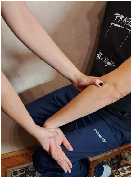
Slika 1. Mill test

Mill test : početni položaj pacijenta je sjedeći. Terapeut stane sa strane na kojoj je bolni lakat. Prvo terapeut jednom rukom palpira lateralni epikondil lakta. Drugom rukom terapeut drži distalni dio ruke pacijenta, točnije oko zapešća i na području metakarpalnih kostiju. Pacijent flektira lakat do 90°. Tijekom palpacije terapeut klijentu ili pacijentu izvodi pasivnu ekstenziju lakta, pronaciju podlaktice, ulnarnu devijaciju i fleksiju zapešća. Test je pozitivan ako se pacijentu pojavi osjećaj bolnosti u području lateralnog epikondila (23).