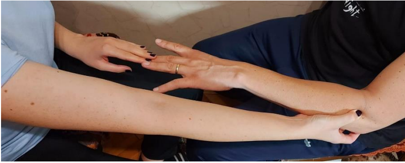
Slika 2. Maudsley test