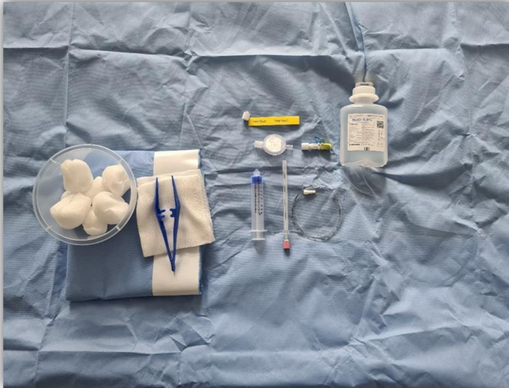
Slika 2. Pribor za izvođenje postupka krvne zakrpe. Autorska fotografija. Mjesto: KBC Sestre Milosrdnice

šprica od 20 ml, sterilna epiduralna igla te epiduralni kateter. Zatim medicinska sestra/tehničar primjenom flebotomije odvaja 20 ml krvi pritom pazeći na aseptičnost i vremenski tijek postupka kako bi se spriječilo grušanje krvi (13).