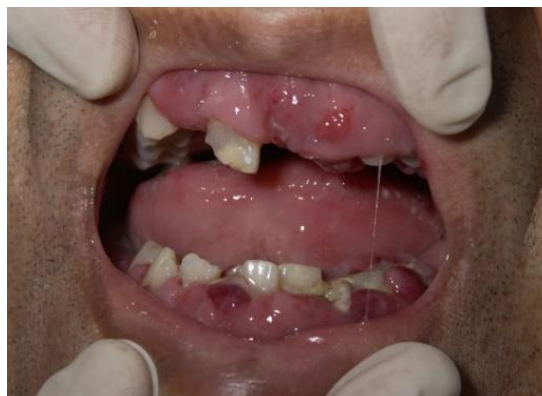
Slika 3. Prikaz bolesnika s akutnom mijeloidnom leukemijom uz izrazitu hipertrofiju gingiva nastalu kao posljedica infiltracije leukemijskim stanicama.

Također se javlja karakteristična bljedoća sluznice usne šupljine uzrokovana manjkom eritrocita ili hemoglobina, kao i gingivalna hiperplazija uzrokovana leukemijskim infiltratima. Zbog izravne infiltracije gingive sa zloćudnim stanicama javlja se edem i eritem gingiva uz prekrivanje dijela ili cijele zubne krune hipertrofičnim gingivalnim tkivom (Slika 3).