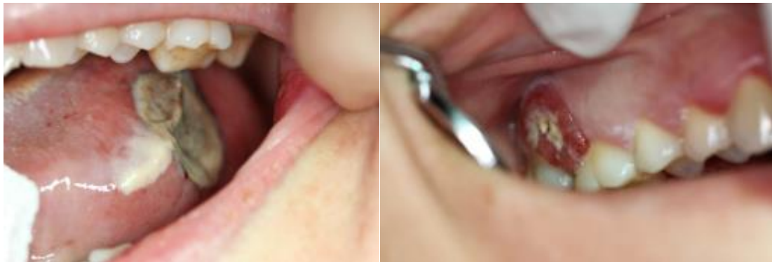
Slika 4. Lezije sluznice jezika (prikaz lijevo) i gingive (prikaz desno) kod bolesnika s akutnom mijeloidnom leukemijom.

funkcije granulocita (15). Zbog neutropenije se razvijaju bakterijske i gljivične infekcije oralnog područja (osobito s gljivicama poput Candida albicans ). Poremećena funkcija leukocita također pridonosi i razvoju virusnih infekcija oralne sluznice (osobito s virusima poput citomegalovirusa i herpes-simpleks virusa). Do pojave oralnih lezija može doći u svim tipovima leukemije, ali su one svakako češće u akutnim oblicima. Mogu biti solitarne ili generalizirane i tipično ih nalazimo na jeziku i gingivama, ali i drugim mekotkivnim dijelovima (Slike 4, 5 i 6).