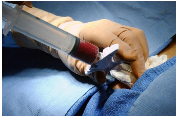
Slika 7. Postupak uzimanja uzorka koštane srži pri biopsiji kosti.

Za postavljanje točne dijagnoze potrebno je prikupiti detaljne anamnestičke podatke, napraviti fizikalni pregled i provesti laboratorijske hematološke, biokemijske, koagulacijske, imunološke i molekularne pretrage. Također je neophodno uzeti uzorak koštane srži putem citološke punkcije i/ili biopsije (Slika 7).