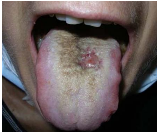
Slika 6. Ulcerativna lezija sluznice jezika kod bolesnika s leukemijom.

Povećanje limfnih čvorova, tonzila i žlijezda slinovnica nastaje kao posljedica infiltracije zloćudnim leukemijskim stanicama. Također, moguće je naći i leukemijske infiltrate u vezivnom i mišićnom tkivu usne šupljine, na jeziku i mekom nepcu te metastatsko zahvaćanje trigeminalnog živaca, odn. njegovih maksilarnih i mandibularnih grana (16). Manifestacije na tvrdim tkivima prvenstveno se očituju kao zubne i koštane promjene. Zubne manifestacije karakterizirane su povećanjem razine cervikalnog karijesa i bolova u zubima te pomicanjem i klimanjem zuba s popuštanjem zubne usidrenosti u alveolu uslijed uništavanja alveolarne kosti. Povećana učestalost zubnog karijesa posljedica je smanjene oralne higijene i salivacije, a pomaci i bolovi u zubima posljedica su invazije zloćudnih stanica u kost i leukemične infiltracije pulpe. Koštane manifestacije karakterizirane su promjenama strukture kosti i vide se kao koštane mase. Infiltracija zloćudnih mijeloidnih stanica u kosti čeljusti (tzv. granulocitni sarkom) zabilježena je ne samo kod AML-a već i kod KML-a. Tipično se vide kao lokalizirane naslage bjelkaste ili zelenkaste strukture koje razaraju kost stvarajući osteolize, nekada i uz prijelome. Zglobne manifestacije obuhvaćaju poremećaje funkcije temporomandibularnog zgloba kao posljedicu infiltracije zloćudnim stanicama što se prezentira otežanim žvakanjem i upalom (artritisom) zglobove čahure (17).