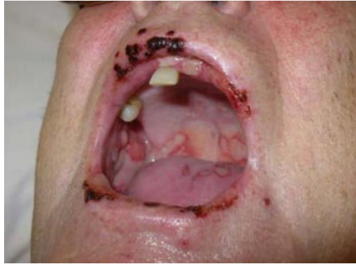
Slika 2. Prikaz petehijalnih krvarenja kod bolesnika s leukemijom.

manifestacija na mekim tkivima su spontana krvarenja sluznice gingiva, nepca, jezika ili usnica (Slika 2). Tipično se javljaju u obliku točkastih (petehijalnih) krvarenja ili hematoma, a nastaju kao rezultat sniženog broja trombocita (trombocitopenije). Krvarenje gingiva najčešće nastaje kao početni oralni znak u slučaju akutne i kronične leukemije (14), a susrećemo ih kada se broj trombocita u perifernoj krvi smanji na < 20 \times 10^9/L .