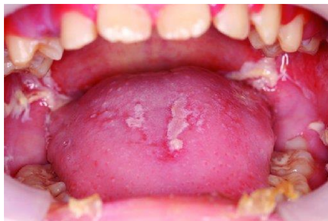
Slika 5. Generalizirani mukozitis u bolesnika s akutnom mijeloidnom leukemijom. Zamijetne su upalne naslage bijele boje.