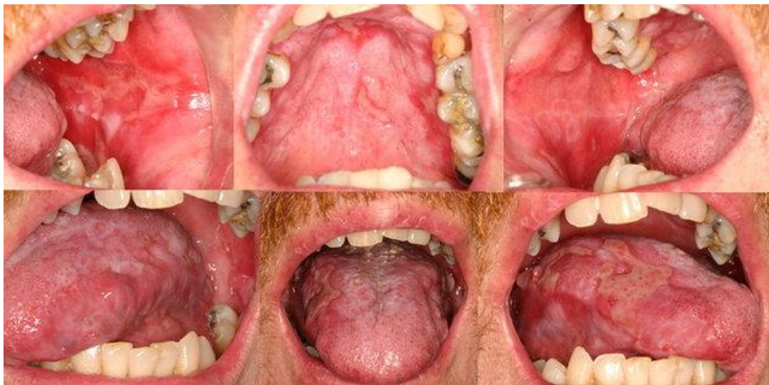
Slika 11. Klinički prikaz ulceracijskih lezija sluznice usne šupljine pri razvoju kronične reakcije presatka protiv primatelja (preuzeto s: Creative Commons).

GVHD nastaje u 30 – 70 % osoba kod kojih se provodi alogena transplantacija matičnih krvotvornih stanica. Osim matičnih krvotvornih stanica, presadak se sastoji i od imunološki kompetentnih stanica (T-limfocita) koje djeluju na timus primatelja u kojem se potom stvaraju autoreaktivni limfociti koji napadaju vlastita tkiva i organe (20, 21). U kliničkoj slici razlikujemo akutni i kronični oblik GVHD-a. Akutni oblik javlja se ubrzo nakon transplantacijskog postupka, dok kronični oblik nastaje mjesecima kasnije. Za akutni oblik karakteristično je pojavljivanje makulopapuloznog osipa na koži, gastrointestinalnih simptoma (mučnina, povraćanje, proljev i ileus) ili holestatskog hepatitisa, dok kronični oblik imitira nekoliko autoimunih i imunoloških poremećaja, uključujući sklerodermiju, Sjögrenov sindrom, primarnu bilijarnu cirozu, obliterativni bronhiolitis, imunološke citopenije i kroničnu imunodeficijenciju (22). Na oralnoj sluznici se javljaju afte, ulceracije i nekrotična područja (Slike 11 i 12).