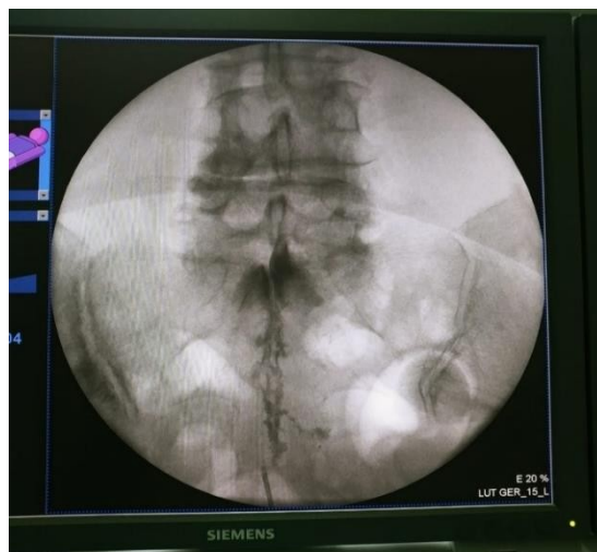
Slika 4. Epidurogram.

Postupak epidurolyze može se podijeliti u nekoliko glavnih koraka. Prvo se određuje područje izvođenja epidurolyze (najprimjereniji je pristup kroz sakralni kanal), injicira se kontrast i učini epidurogram (1). Na taj način se potvrđuje položaj igle i uvodi kateter. Vrh katetera u dužini 2-3 cm se zakrivi 15^{\circ} kako bi se poboljšalo usmjeravanje prema željenom korijenu živca (1). Kad je kateter u dobrom položaju ubrizgava se hijaluronidaza. Nakon toga se, prema određenju liječnika, ubrizgava bupivacain 0,2% ili ropivacain 0,2% s triamcinolonom 40 mg ili dexamethasonom 4 mg. Opcionalno, 30 minuta poslije (ako ne postoji motorni blok) injicira se fiziološka otopina. Svi navedeni lijekovi, kao i antibiotik koji se primjenjuje pola sata prije postupka u recovery room-u , upisuju se u sestrinsku listu.