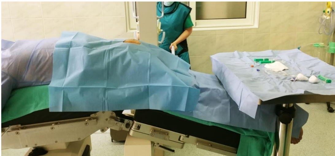
Slika 3. Priprema za postupak epidurotolize.

Medicinska sestra, unutar kirurške sale, obavezno oblači zaštitnu opremu za rad u kirurškoj sali s naglaskom na opremu koja štiti od štetnog zračenja, budući da se proces epidurotolize radi pod stalnom kontrolom rendgen aparata. Također, osim što asistira liječniku u postupku epidurotolize, u sestrinsku listu upisuje sve postupke prije i tijekom zahvata, lijekove koje je pacijent primio, te početak i završetak samog postupka epidurotolize (12). Osim toga, postavlja venski put, EKG elektrode, prati vitalne parametre, pruža podršku, odgovara na pitanja pacijenta, asistira prilikom postupka te prati pacijenta sve do postoperativne faze (12).