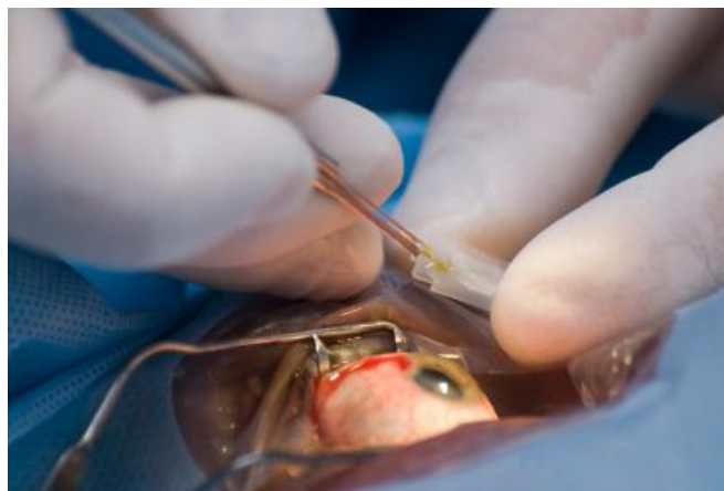
Slika 2. Operacija katarakte

Danas većina katarakti se obavlja ambulantno, te se pacijenti već nakon 5-6 sati nakon operacije otpuštaju s odjela na skrb kući. U ovom slučaju pratnja igra veliku ulogu, jer nakon operacije nosi se povez na operiranom oku te zbog manjka vida smanjuje se ravnoteža te su padovi vrlo lako mogući. Za kući pacijent će dobiti kapi za njegu oka i acetazolamid za prevenciju edema makule ili rožnice. Kako su pacijenti najčešće osobe starije životne dobi smjernice u vezi izbjegavanja jakog svjetla (ili nošenje sunčanih naočala), primjene tableta i kapi, uklanjanje eventualnih bolova u oku analgeticima i oprez zbog gubitka ravnoteže potrebno je iskazati i pratnji pacijenta (14, 15).