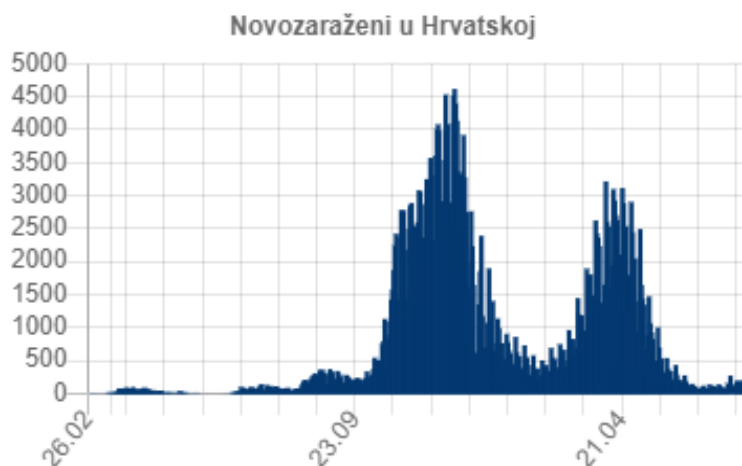
Slika 3. Grafički prikaz novozaraženih od 26.02.2020. do 30.07.2021. godine (Izvor: https://www.koronavirus.hr/ , pristupljeno 30.07.2021.)

U Hrvatskoj je na današnji dan 363 397 osoba bilo zaraženo koronavirusom, od kojih se većina (354 055) osoba oporavilo, a zabilježeno je 8 254 smrtna slučaja. U proteklih nekoliko dana, Hrvatska drži konstantan broj novozaraženih (oko 200 slučajeva dnevno). A od prvog zaraženo do danas grafički prikaz novozaraženih je vidljiv na slici 3. Prema slici jasno je vidljivo kada je pandemija u Hrvatskoj bila na vrhuncu, te kako je trenutno stanje stabilno (17).