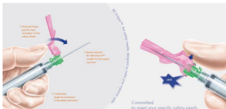
Slika 1. Sigurnosni dodatak na iglu

Izlaganje patogenima koji se prenose krvlju jedno je od najsmrtonosnijih opasnosti s kojima se zdravstveni djelatnici kao i drugo nezdravstveno osoblje svakodnevno suočava. Preko 80 % ozljeda iglama može se spriječiti upotrebom sigurnih dodataka na oštre predmete (Slika 1.), koji zajedno s edukacijom djelatnika i kontrolama radne prakse, mogu smanjiti ozljede za preko 90 % (26).