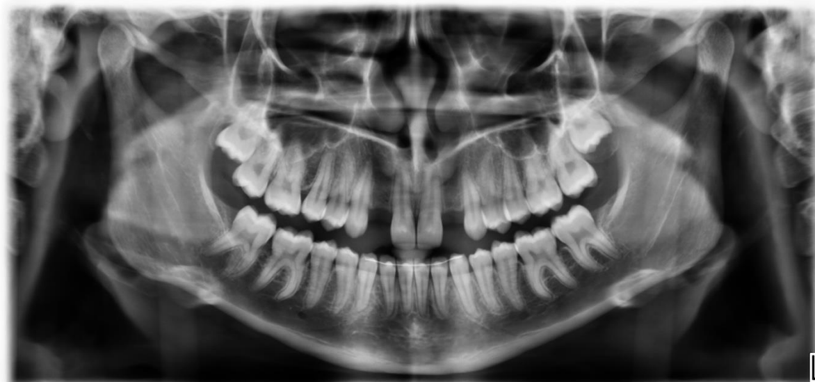
Slika 2. Hipodoncija zuba 12 i 22 (ljubaznošću doc. dr. sc. Bruno Vidaković, dr. med. dent., spec. oralne kirurgije)

Etiologija hipodoncije bit će detaljnije objašnjena u nastavku rada.