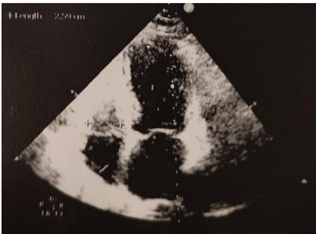
Slika 3. UZV prikaz srca bolesnice sa sindromom slomljenog srca.