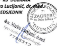
Slika 2. Slika zamolbe za odobrenje znanstvenog istraživanja