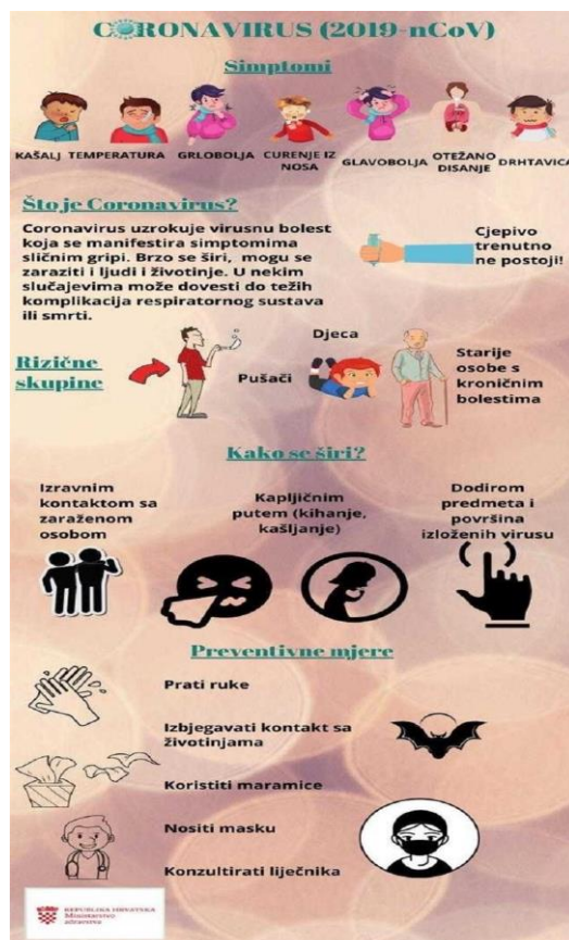
Slika 3. Primjer jednostavne komunikacije s javnošću o suzbijanju pandemije.