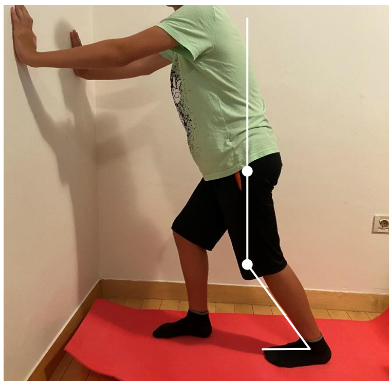
Slika 9. Vježba istezanja Ahilove tetive uz flektirano koljeno (uz korekcije pacijent kako bi zadržao stopalo na podlozi smanjio je fleksiju u koljenu i postavio trup k naprijed)