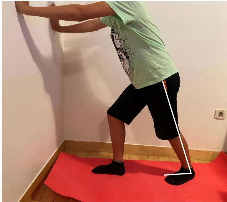
Slika 8. Vježba istezanja Ahilove tetive uz ekstenzirano koljeno (uz korekcije zbog izostanka dorzifleksije gležnja, pacijentovo stopalo je u položaju valgusa i nije u mogućnosti u potpunosti ekstenzirati koljeno) – „izvorna slika autora“