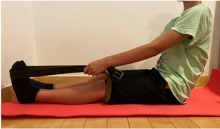
Slika 4. Vježba istezanja Ahilove tetive povlačeći rukama remen, ručnik ili traku za trening prema sebi (uz korekcije pacijent je i dalje izvodio varus zbog nemogućnosti izvođenja dorzifleksije)