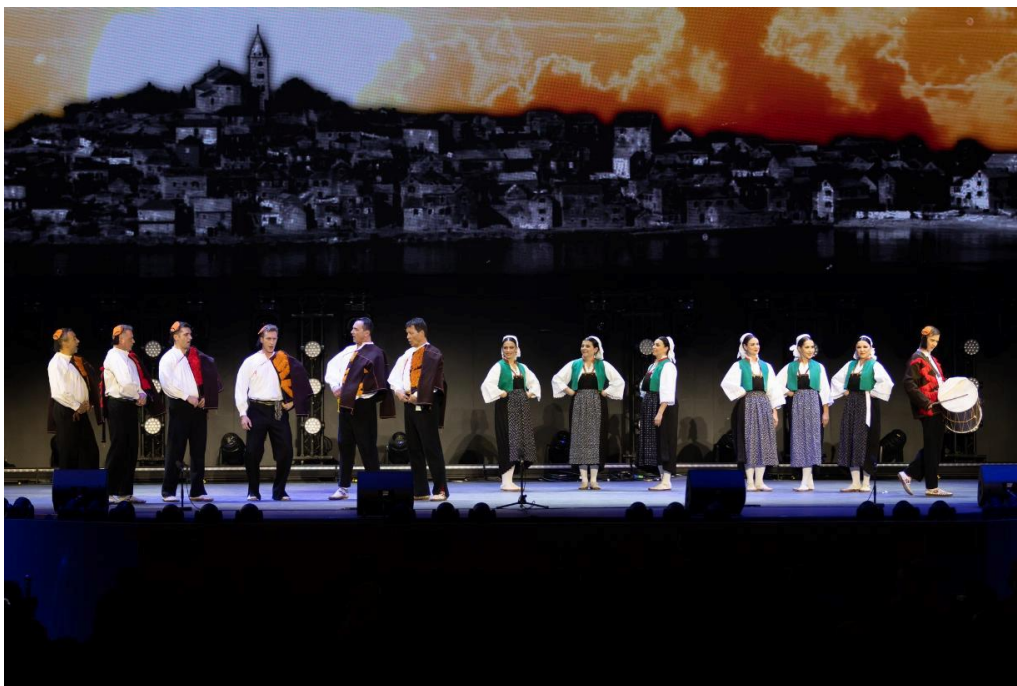
Slika 3. Umjetnici ansambla „LADO“ prezentiraju Republiku Hrvatsku na svjetskoj izložbi EXPO u Dubaiju, gdje su se istaknuli s više manjih nastupa u smanjenom sastavu ansambla