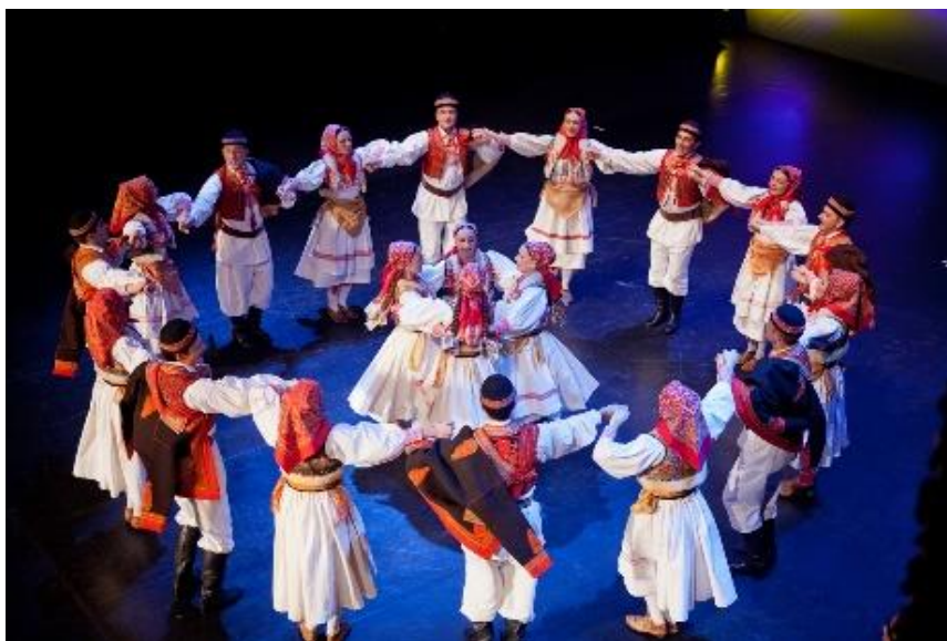
Slika 2. Umjetnici ansambla „LADO“ u izvođenju prigorskih folklornih plesova u najčešćoj folklornoj plesnoj formi - kolu

Iako je veoma teško zamijeniti direktan kontakt umjetnika i publike, „LADO“ je ostao povezan s ljubiteljima folkloru i tradicije putem svog YouTube kanala gdje su objavljene snimke raznoraznih koncerata. S vremenom, kako su mjere jenjavale i dopuštala su se okupljanja uz određene uvjete, tako su se i umjetnici ansambla postepeno vraćali svome poslu - napornom i hvalevrijednom radu.