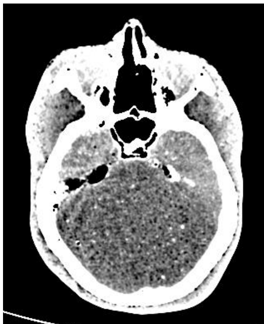
Slika 7. CT snimka glave fantoma korištenog u ovom radu.