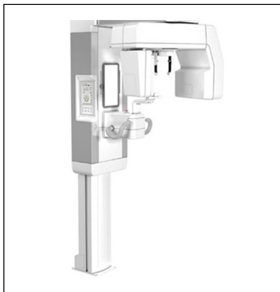
Slika 3. CBCT uređaj proizvođača Soredex, model Cranex 3Dx.

Mjerenja su provedena na uređaju CBCT u Radiološkoj ordinaciji dentalne medicine Lauc u Osijeku (Slika 3.).