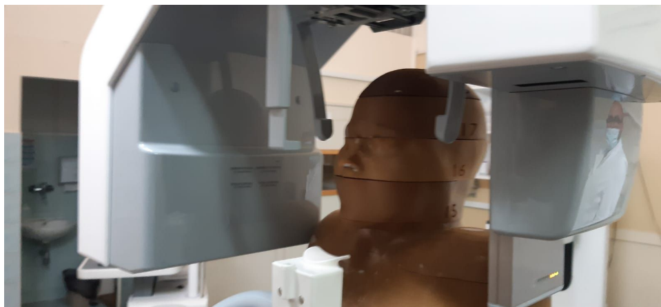
Slika 4. Snimanje fantoma trudnice ortopanom.