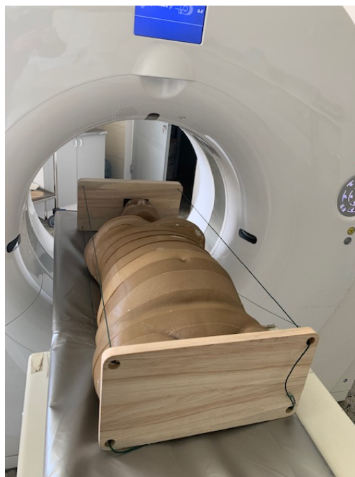
Slika 6. Oslikavanje čeljusti fantoma trudnice s umetnutim detektorom u području fetusa.

Gore navedeni uređaji su specijalizirani uređaji u dentalnoj radiografiji. Ipak, u dentalnoj medicini se i dalje koriste i neki postupci s radiološkim uređajima opće namjene. Jedan od takvih uređaja je CT. Mjerenja fetalne doze pri snimanju čeljusti CT uređajem prikazano je na slici 6.