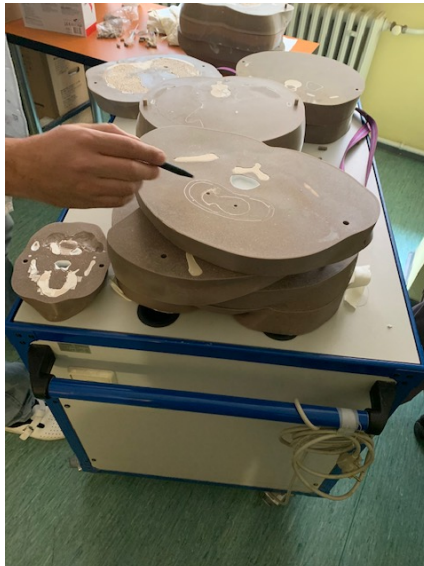
Slika 2. Slojevi fantoma sa šupljinama u koje se mogu postaviti dozimetri radi mjerenja ozračenja.